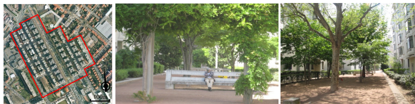
Figure 7, 8 et 9. Quartier des États-Unis à Lyon, France, Architecte : Tony Garnier (1869-1948). Réalisation : 1921-1934

Les « oasis » existent aussi dans des formes urbaines très ouvertes, sur le sol herbeux et plat du campus de La Doua à Lyon, dans les cours-promenades végétalisées du quartier des États-Unis à Lyon (1929). Dans ce dernier ensemble d'îlots semi-fermés qui construisent des cours urbaines successives, comme on peut le voir dans l'illustration suivante, l'habitant vit une promenade rythmée de clairières accueillantes.