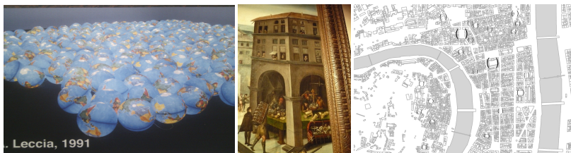
Figure 1 gauche. Ange Leccia, biennale d'art contemporain Lyon 1991