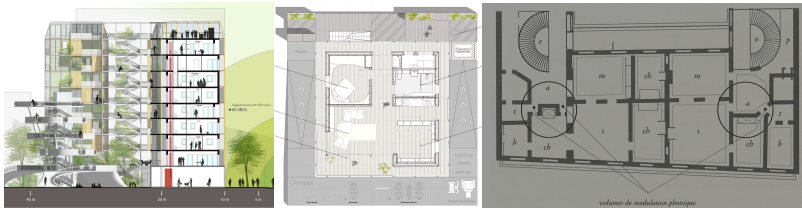
Figures 10 et 11. Canopéa@, Team Rhône-Alpes architectes (2012) Figure 12 à droite. Appartement parisien, Visconti architecte (1835) publié dans l'ouvrage de César Daly L'architecture privée au XIX e s. sous Napoléon III , tome 1, A. Morel et c ie , Paris, 1864

Il faudrait sans doute imaginer pour demain une conception de logements plus « anthropotechniques » que techniques, permettant au citoyen de se construire des parenthèses perceptives au service de ses expériences et de ses échanges interactifs avec les vivants. Les plans de la nanotour Canopéa (2012) (team Rhône-Alpes architectes) et de l'appartement dessiné par l'architecte Visconti (1835) l'illustrent. Dans leurs cours et traités au XIX e , les architectes insistent particulièrement sur les manières de dessiner dans le plan les parcours, de manière à rendre possible l'évitement des rencontres.