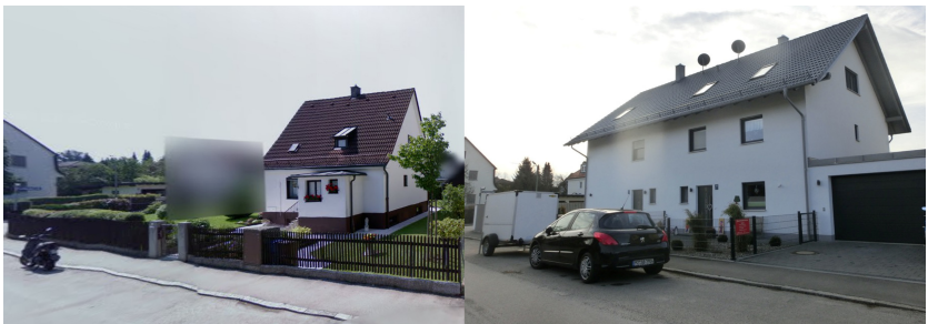
Figure 2. Maison ancienne (gauche) et densifiée (droite) à Waldtrudering, sources Google Street View Juillet 2008 et Kazig 2015

À Waldtrudering, la densification observée est régie majoritairement par un marché de promotion immobilière qui consiste à détruire la maison existante et à reconstruire un immeuble/maison abritant des appartements. Cette forme s'explique par une logique de changement générationnel couplé à un coût du foncier aujourd'hui très élevé (à partir de 1800 €/m 2 terrain constructible). L'ancienne génération a contribué au développement du quartier après la deuxième guerre mondiale par la construction de maisons souvent simples et petites sur des terrains assez grands (entre 800 m 2 et 1200 m 2 ) (Figure 2). La nouvelle génération, composée normalement de deux ou trois enfants, vend généralement à des promoteurs immobiliers, car en raison du coût du foncier un des enfants n'arrive pas à verser les parts restantes à ses frères et sœurs. Ces promoteurs sont spécialisés dans le développement de petits immeubles. Ils essaient de maximiser le profit en optimisant le droit de construction autorisé.