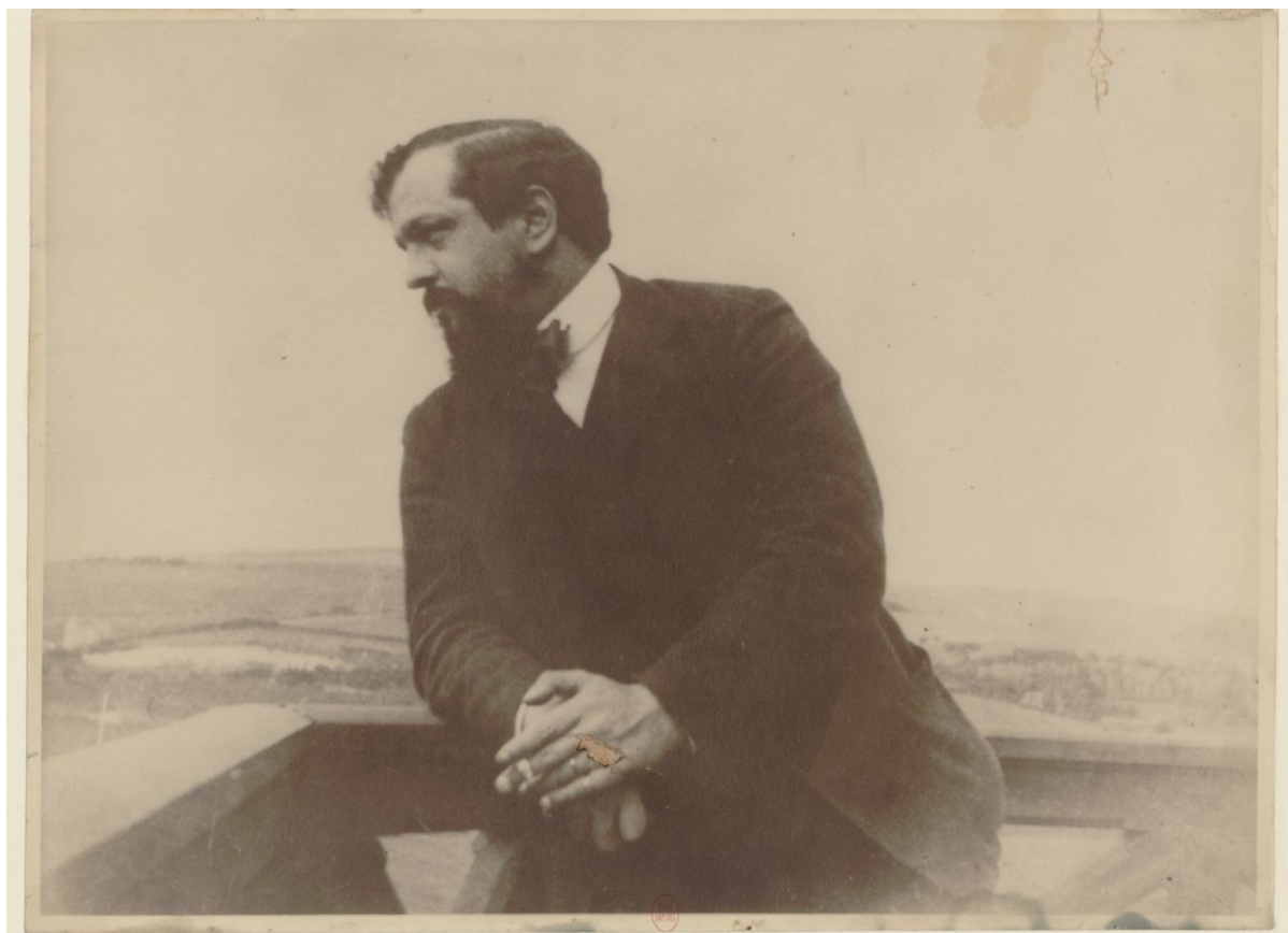
Figure 2 : Claude Debussy à Pourville en 1904. Photographie : 17 x 22 cm, IconMUS2.

par ces marchands de Kultur » 46 . L'ambition de Debussy est de composer une sonate, non pas dans la définition courante du XIX e siècle, mais dans une définition antérieure à 1750, beaucoup plus libre. Il souhaite de même intituler cette pièce « Pierrot fâché par la lune ». Faut-il y voir une évocation du Pierrot de la Commedia dell'arte ou une critique de Schönberg et de son Pierrot lunaire , paru en 1912 ? 47