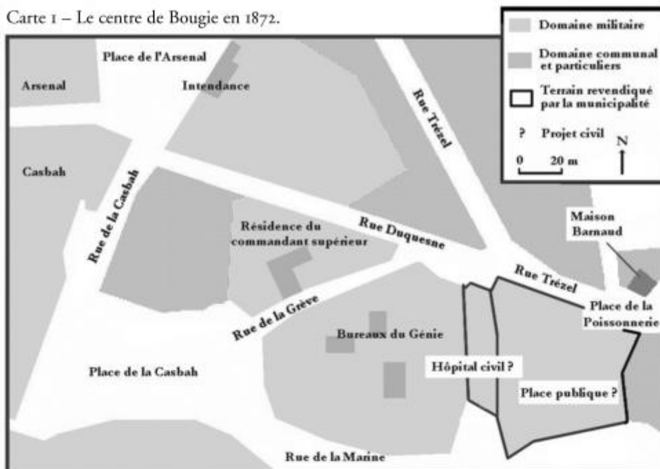
Carte 1 – Le centre de Bougie en 1872.

auquel sont conviés ses employés, entre quinze et vingt personnes. S'il en est besoin, la pétarade est un élément supplémentaire pour attirer joyeusement l'attention. Les enfants en particulier s'amuse à se renvoyer les projectiles mal éteints.