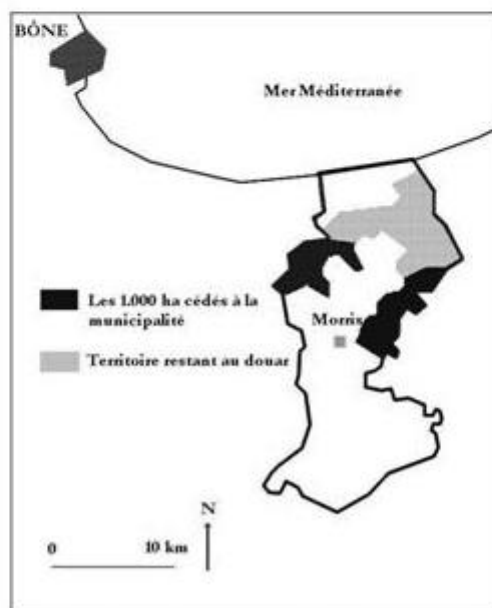
Carte 3 - Le territoire des Beni Ujjin en 1889