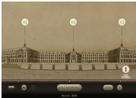
(fig.3) «Table d'orientation numérique» avec accès à des commentaires audio. Capture écran du point d'expérience n°9 du parcours Imayana.