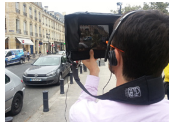
(fig.5) Principe de portage de la machine Imayana.

Cette individuation de la visite est sans doute une des particularités qui recueille le plus de critiques de la part des observateurs extérieurs. A priori , ces outils s'adaptent en effet mal aux visites à plusieurs et font écran à une appréhension globale du site. Cet isolement de l'observateur est d'autant plus marqué par l'exploitation d'un système de portage conçu spécifiquement pour ce dispositif (fig. 5). Cette sorte de camera obscura luttant contre les rayons du soleil tant en protégeant la machine d'éventuels chocs crée en