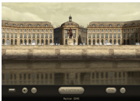
(fig.4) Restitution de la place de la Bourse au XVIIIe siècle. Capture écran du point d'expérience n°9 du parcours Imayana.

À l'inverse, en position tête haute, le même paysage est restitué selon un rendu réaliste (fig. 4). Ce rendu simule les lois simples de l'optique en décrivant notamment comment la lumière se réfléchit sur les objets. D'un point de vue technique, la création de ce type de rendus est fortement