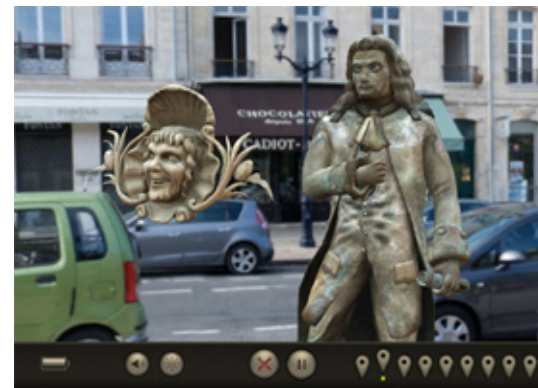
(fig. 1) Animation de la statue en bronze de Tourny et de mascarons. Capture écran du point d'expérience n°3 du parcours Imayana.

Orienté grâce au GPS intégré à l'Ipad2, il accède par l'intermédiaire d'une carte interactive à différents contenus aux fonctions prescriptives caractéristiques de l'industrie touristique : signalement et description des monuments proches et dignes d'être vus