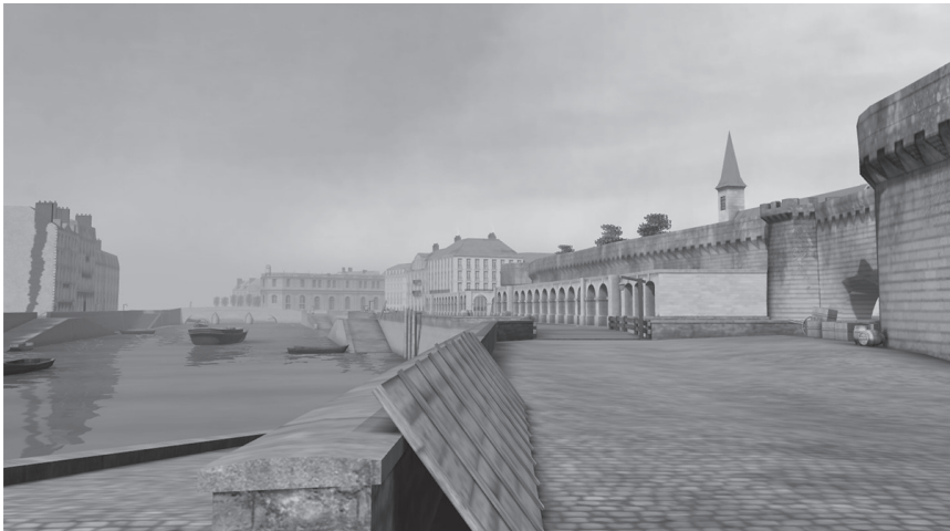
Figure 3 : visite en vision subjective des quartiers emblématiques de la ville de Nantes au XVIIIe siècle

La visite des quartiers emblématiques se fait en vision subjective, grâce à un déplacement libre, dans une zone délimitée (fig. 3). Les usagers ne peuvent pas pénétrer dans ces monuments virtuels qui sont seulement observables de l'extérieur. L'emploi de textures photoréalistes, issues de reportages photographiques effectués sur des monuments nantais, vise principalement à immerger le visiteur dans un univers historique, tout en exploitant un style proche des univers graphiques que proposent aujourd'hui le cinéma ou les jeux vidéo. Il s'agit bien ici de créer cet effet d'histoire 8 , en accumulant objets et détails au caractère historique, citations destinées à donner une qualité d'authenticité. L'environnement architectural est ainsi enrichi d'un corpus de mobilier urbain (enseignes, systèmes d'éclairage, marchés, etc.) mais l'absence de personnage accentue toutefois l'impression de ville abandonnée et désertée.