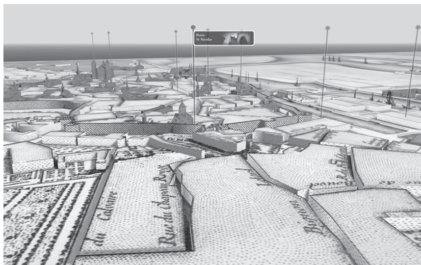
Figure 2 : interface de la maquette virtuelle

Dans un premier temps, le public survole de manière totalement libre une représentation schématique et tridimensionnelle de Nantes en 1757. Ce modèle virtuel a été construit à partir de la numérisation en haute définition d'un fac-similé du plan Cacault, la topographie générale de la cité étant suggérée par de simples volumétries. Cette maquette virtuelle sert d'interface d'accueil permettant de localiser les onze sites visitables, identifiés par des hampes (fig. 2).