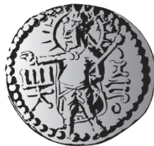
Monnaie Kushana, représentation de Mithra

UN DISPOSITIF ÉDITORIAL THÉMATIQUE. — Autour d'un thème ou d'une problématique, chaque numéro de MEI « Médiation et information » est composé de deux parties. La première est consacrée à un entretien avec les acteurs du domaine abordé. La seconde est composée d'une quinzaine d'articles de recherche.