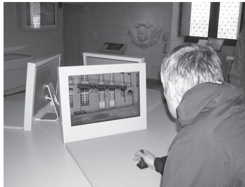
Figure 1 : visite virtuelle de la ville de Nantes au XVIIIe siècle.

Concrètement, le dispositif est accessible grâce à six moniteurs en accès libre, à partir desquels l'utilisateur se déplace dans cet univers virtuel, à l'aide d'un joystick (fig. 1). La découverte interactive de la cité est fortement scénarisée. La visite, développée au moyen d'un logiciel libre 5 , s'appuie sur un scénario qui planifie l'enchaînement de séquences plus ou moins immersives. Bien que l'objectif premier aspirât à faire évoluer librement le public au cœur d'un vaste territoire entièrement restitué 6 , les réflexions tant ergonomiques que scientifiques obligèrent à restreindre ce choix, pour orienter la conception vers une modélisation moins étendue et plus encadrée. L'appréhension de la visite se fait donc en trois temps distincts.