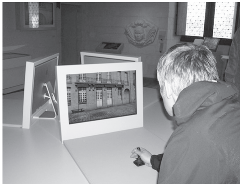
Figure 1 : visite virtuelle de la ville de Nantes au XVIIIe siècle.

Concrètement, le dispositif est accessible grâce à six moniteurs en accès libre, à partir desquels l'utilisateur se déplace dans cet univers virtuel, à l'aide d'un joystick (fig. 1). La découverte interactive de la cité est fortement scénarisée. La visite, développée au moyen d'un logiciel libre 5 , s'appuie sur un scénario qui planifie l'enchaînement de séquences plus ou moins immersives. Bien que l'objectif premier aspirât à faire évoluer librement le public au cœur d'un vaste territoire entièrement restitué 6 , les réflexions tant ergonomiques que scientifiques obligèrent à restreindre ce choix, pour orienter la conception vers une modélisation moins étendue et plus encadrée. L'appréhension de la visite se fait donc en trois temps distincts.