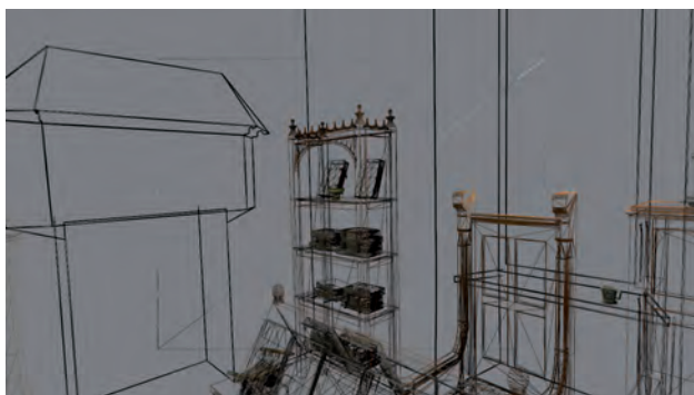
Fig. 1. Modèle numérique 3D temps réel vue en fil de fer.