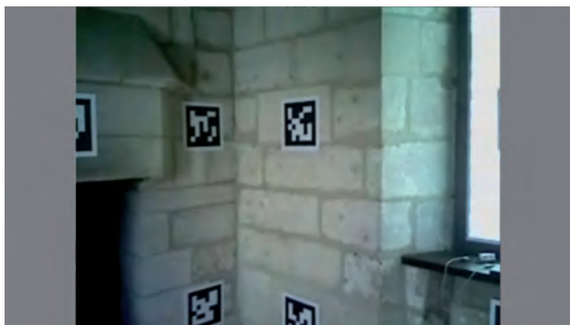
Fig. 2. Entrée vidéo affichée sur l'UMPC.