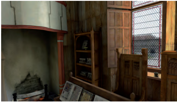
Fig. 4. Effet de "peinture" du fond terminé. Immersion totale dans le cabinet de travail de Charles V en 3D temps réel.