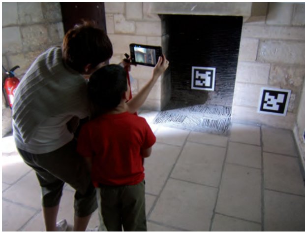
Fig. 5. Utilisation sur site lors de l'expérimentation. Illustration de la dimension sociale de l'UMPC.

accord avec le SDAP. La fixation des marqueurs a été éprouvée afin de vérifier sa bonne tenue dans le temps. Les conditions réelles ont aussi permis de revoir certains points comme l'éclairage ambiant, facteur clé aussi bien pour l'acquisition des marqueurs que pour la visibilité sur l'écran d'affichage. Le matériel a été testé afin d'optimiser sa durée d'utilisation, d'évaluer le temps de recharge ainsi que le nombre de rotations des batteries en condition réelle d'exploitation.