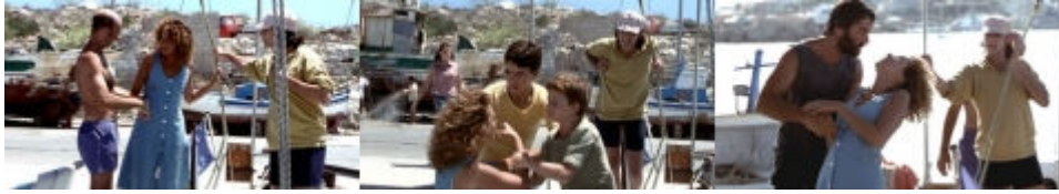
Fig. 2 Photogrammes : 51'33" (Grazia se présente aux deux Français), 52'08" (les fils de Grazia interviennent pour qu'elle descende du bateau), 53'08" (Pietro bat sa femme).

cela est significatif dans la mesure où, après Pier Luigi dont l'accent est clairement originaire du Nord d'Italie, le « danger » est à nouveau connoté comme « étranger ».