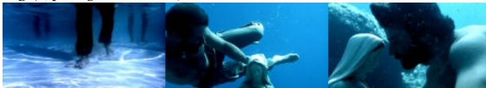
Fig. 7 Photogrammes : 1h08'40", 1h13'54", 1h13'59

78 Le deuxième volet est consacré à Pietro ( fig. 7 ) : encore une fois la douleur est la matrice qui pousse les personnages à plonger dans la mer. Dans une séquence l'homme, qui cherche désespérément Grazia, trouve sur la plage la robe qu'elle endossait le jour de sa disparition : un plan sous l'eau nous montre les jambes de Pietro et celles des autres hommes qui cherchent dans la mer le corps de la femme ( fig. 7 ; photogramme 1h08'40").