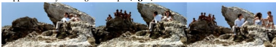
Fig. 1 Photogrammes 44'24", 44'47", 45'40"

43 La séquence s'ouvre sur les deux adolescents qui se dirigent, en scooter, vers les rochers dans le but de demeurer seuls : Pasquale et Filippo, en les voyant ensemble, intimement aussitôt à leur sœur l'ordre de rentrer à la maison ; elle ne les écoute pas et s'installe avec le jeune sur un fauteuil en haut d'un rocher. Les deux frères, accompagnés de leurs amis, s'assoient sur un autre rocher pour les contrôler et Filippo est envoyé déranger le couple ( fig. 1 ).