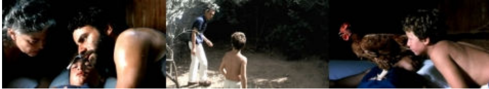
Fig. 5 Photogrammes : 1h13'08" (Pietro et sa mère essaient de comprendre ce que Pasquale chuchote), 1h15'03" (Pier Luigi et Filippo se rendent dans le poulailler pour attraper une poule), 1h15'43" (Filippo place la poule sur le ventre de son frère, en espérant qu'elle puisse l'aider à guérir)

71 La situation parvient à une solution grâce à la synergie entre l'« étranger » Pier Luigi et le « familier », c'est-à-dire Filippo (le fils cadet) : le premier a l'idée d'aller chercher une poule dans le poulailler, en confirmant ainsi la vocation de la langue à la rationalité, alors que le deuxième attrape la poule, en témoignant de la praticité du dialecte, corollaire d'un certain type de savoir-faire et d'une familiarité avec l'espace, y compris les objets, animés et inanimés, qui le peuplent ( fig. 5 ; photogrammes : 1h15'03", 1h15'43").