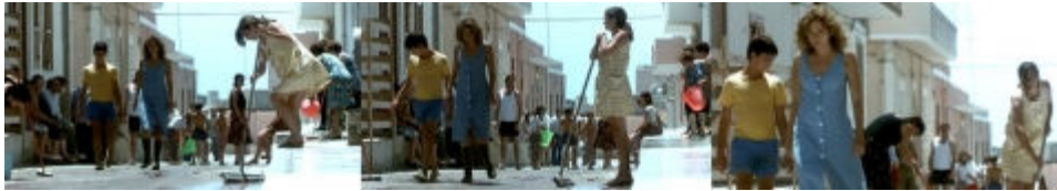
Fig. 4 Photogrammes : 56'05", 56'10", 56'15"