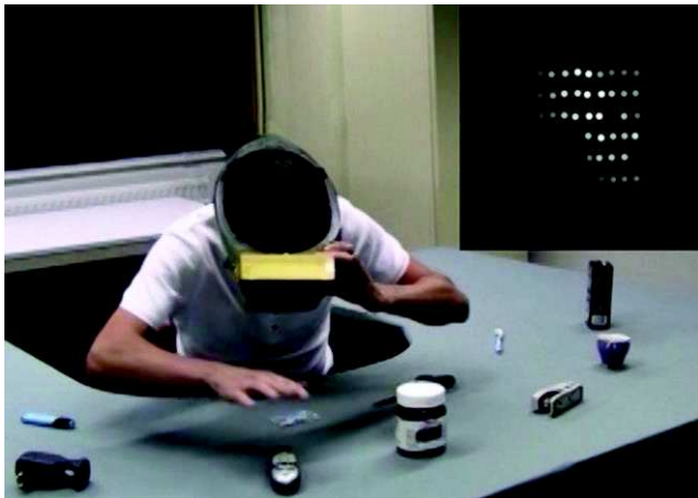
Fig. 4. : Expérience de simulation de neuroprothèse visuelle. Le casque de réalité virtuelle affiche la scène visuelle telle qu'elle serait perçue par une personne non-voyante implantée avec une neuroprothèse visuelle (image en haut à droite). La tâche à effectuer consiste ici à saisir un objet précis sur la table.

l'ANR), les établissements, les collectivités locales, etc. Ces durées ne dépassent généralement pas 4-5 ans après lesquels le consortium se dissout. Les partenaires partent alors de façon isolée ou fragmentée vers de nouveaux projets. Par conséquent, certaines recherches ne sont ni poursuivies, ni transférées vers l'industrie.