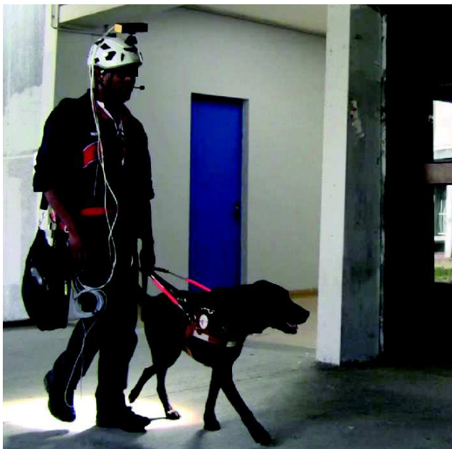
Fig. 1. Prototype de laboratoire du dispositif NAVIG incluant un GPS, des centrales inertielle, des caméras embarquées, ainsi qu'une interface utilisateur adaptée aux déficients visuels (reconnaissance de parole et synthèse de parole ou de sons 3D par conduction osseuse). Le guidage et la description de l'espace sont réalisés en augmentant l'environnement avec du texte et/ou des sons spatialisés.

Le projet a abouti à la conception et l'évaluation d'un prototype de laboratoire (voir Fig. 1). Il a permis de faire des progrès significatifs dans des domaines variés appartenant aux sciences cognitives (représentations spatiales chez les déficients visuels, perception auditive 3D, modélisation de la vision), et à l'IHM (interaction non-visuelle, interaction en mobilité, technologie d'assistance) (voir [2], [3]). Ces objectifs de recherche fondamentale formulés par les laboratoires étaient accompagnés de la volonté d'augmenter l'expertise et la compétitivité des deux PME participantes, notamment en aboutissant à des innovations en vision artificielle embarquée, en géolocalisation du piéton et en technologies de guidage pour les déficients visuels. Ces innovations ont été appliquées dans les domaines des technologies d'assistance pour les déficients visuels évidemment, mais aussi dans des domaines d'activité différents (navigation autonome de véhicules intelligents, navigation pour piétons, robotique, etc.).