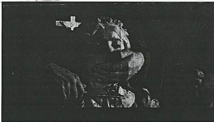
Fig. 15 — NO-DO (Quiroga, 2009) : l'assassinat d'une fillette par un prêtre ou les monstres ne sont pas uniquement ceux que l'on croit.