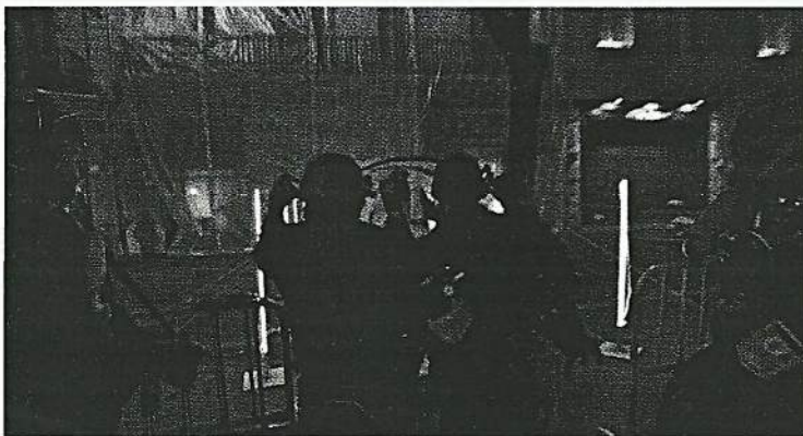
Fig. 16 — REC 2 (Balagueró et Plaza, 2009) : la zone sécurisée et interdite, une image du secret-mensonge d'État.