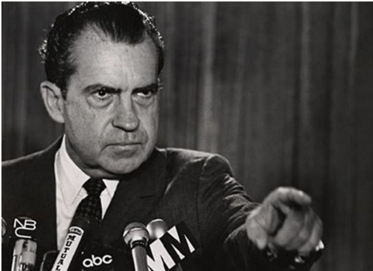
En 1974, l'affaire du Watergate provoqua la démission de Richard Nixon.

À la différence des éléments de la définition évoquée plus haut, il n'est pas nécessaire que ces trois conditions soient intégralement observées. On peut vouloir parler de conspiration même si l'effet recherché n'a finalement pas été atteint, comme dans le cas du Watergate. Par ailleurs, une conspiration peut très bien être révélée dès qu'elle a porté ses fruits, et ne pas rester toujours secrète – c'est le cas de presque tous les coups d'État. Enfin, il se peut très bien qu'une grande partie du public soit indifférente à ce que révéleront des lanceurs d'alerte.