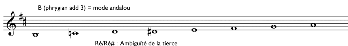
Exemple 7 : Échelle utilisée pour les solos

Par ailleurs, les solos prennent appui sur le mode phrygien (sur si ), auquel est ajoutée la tierce majeure, ré# – le New Real Book propose comme échelle : B phrygian add 3 . L'ambivalence de la tierce ré , bécarré ou dièse, correspond à la fois à la blue note 3 dans la gamme blues, et à une caractéristique du mode andalou célébré dans le flamenco et les autres formes de musique populaire espagnole. Le mode de mi avec la tierce flottante est d'ailleurs parfois appelé « gamme espagnole » (Siron, 2002 : 106). Tous les musiciens joueront sur cette ambiguïté dans leurs improvisations, comme Coltrane, de façon insistante, dans l'introduction de son solo (à partir de 13'20'').