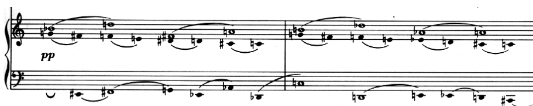
FIG. 18. – Op. 25 n° 3, mesures 3 et 4, piano.

3/ Enfin, la main gauche (ou basse) se démarque de la stabilité rythmique et mélodique des voix de la main droite. Elle laisse place aux figures de silence, aux liaisons, et alterne les valeurs rythmiques, tel un contrepoint fleuri par rapport à un cantus firmus . Son phrasé, très souvent inversé par rapport aux autres voix, l'amène à enjambrer la barre de mesure, tandis que la longueur de ses lignes mélodiques, parfois sinueuses et usant çà et là de larges intervalles, peut atteindre trois mesures et approcher le total chromatique 1 . Il faut, en outre, noter que la basse alterne lignes mélodiques en legato par deux ou par trois (mesures 3 à 5, mesure 30) et figures en contre-temps, comme des hoquets, séparés par des silences, mais dont les grandes liaisons par groupes de trois ou quatre notes affirment l'union (mesure 2, mesure 29, mesures 31 et 32). Pour finir, remarquons que la liberté de la voix de basse provoque des dissonances extrêmement fréquentes, au demi-ton ou au ton – souvent en intervalles redoublés – avec les voix de la main droite (figure 18) :