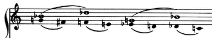
FIG. 17. – Op. 25 n° 3, voix intérieure.

2/ Apparaissant aux mêmes mesures que la voix supérieure décrite plus haut, qu'elle sous-tend donc en permanence, la voix intérieure (ou voix inférieure de la main droite) est une descente chromatique, de sol à do , phrasée deux en deux. Son rythme est régulier – les valeurs sont deux fois plus courtes que celles de la voix supérieure (figure 17) :