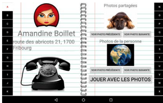
Figure 1. Interface de Navigation.

Une fois arrivé au contact désiré, l'utilisateur peut choisir d'effectuer un appel en visioconférence en cliquant sur l'icône du téléphone ou de visualiser les photos partagées avec le contact. Ces photos peuvent être utilisées dans les jeux cognitifs. Le but de cette section est de profiter des photos personnelles du contact pour stimuler la mémoire de l'utilisateur et lui faire souvenir des moments de vie partagés avec cette personne. Cela constitue déjà un premier exercice cognitif pour l'utilisateur et pourrait être argument de discussion dans des futures conversations avec cette personne à contacter. L'application pourrait aussi indiquer les dates d'anniversaire des contacts pour enclencher des occasions pour appeler ce contact.