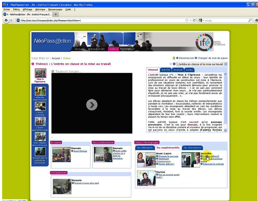
Figure 1 : Extrait d'un enregistrement de l'écran au cours d'une situation d'utilisation de l'ENF. Figure 1: Sample of a screen capture in a situation of DLE use