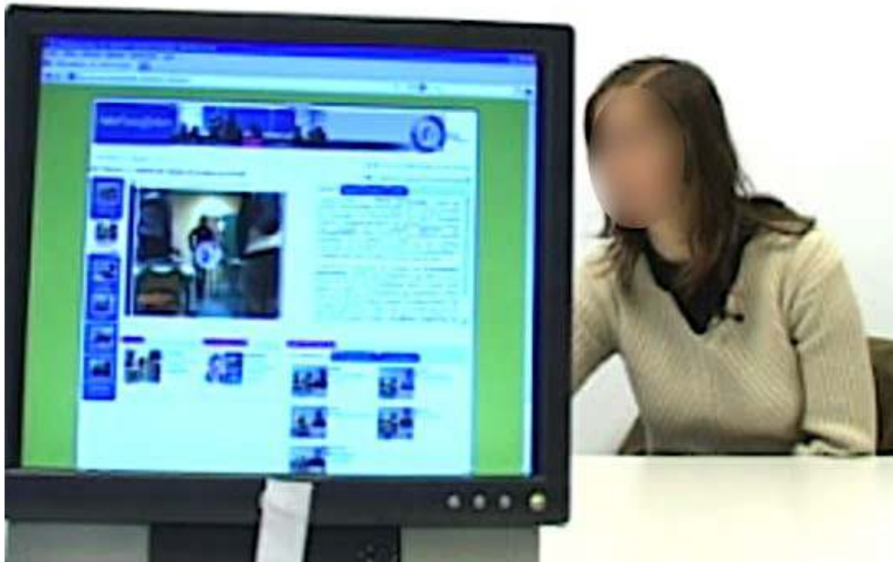
Figure 2: Sample of a recording of a resituating interview supported by digital traces of the activity