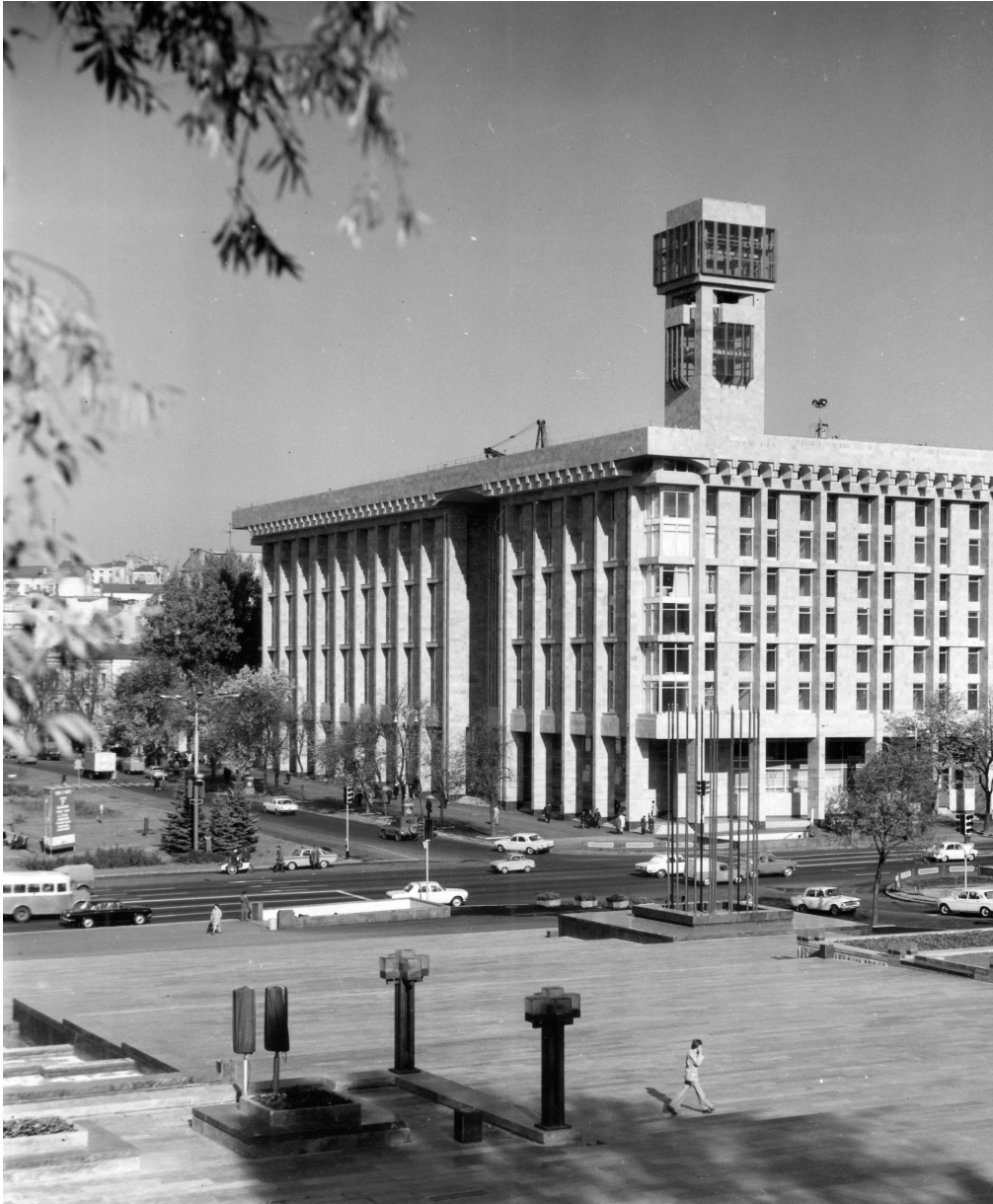
Fig. 4. La Maison des syndicats. 1982, arch. O.Malinovs'kyj et O.Komarovs'kyj.