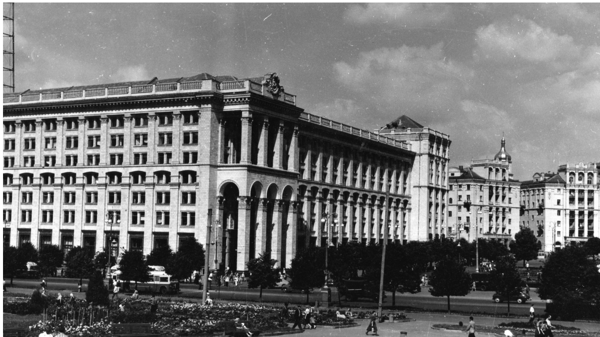
Fig.3. Place Kalinine. Photographie des années 1950.

De 1952 à 1958, sur le flanc d'ouest de la place Kalinine ont été construits le bâtiment de la Poste Centrale, un immeuble de bureaux du Ministère de l'industrie alimentaire et trois immeubles résidentiels (Fig.3).