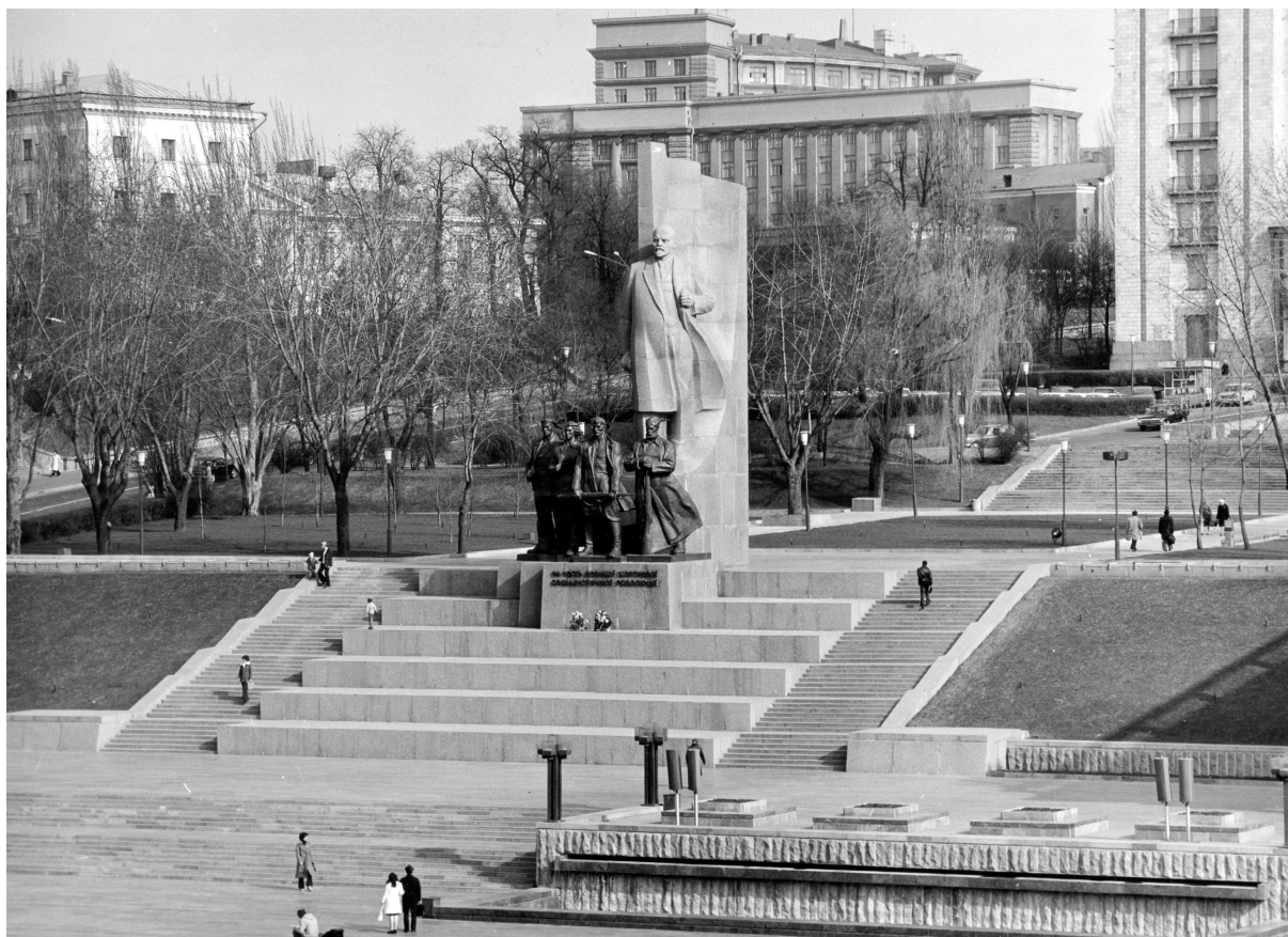
Fig. 4. Le monument de Lénine sur la place de la Révolution d'Octobre. 1977. sc. V. Borodaj, V. Znoba, I. Znoba, arch. O. Malinovs'kyj, M. Skybyc'kyj. Photographie des années 1980.

À gauche, la façade du conservatoire se transforme en gigantesque iconostase socialiste : la colonnade du premier étage offre un cadre idéal aux portraits des membres du Politbureau. Ils se répètent, dans un ordre protocolaire très strict, de part et d'autre de la figure centrale de Leonid Brežnev.