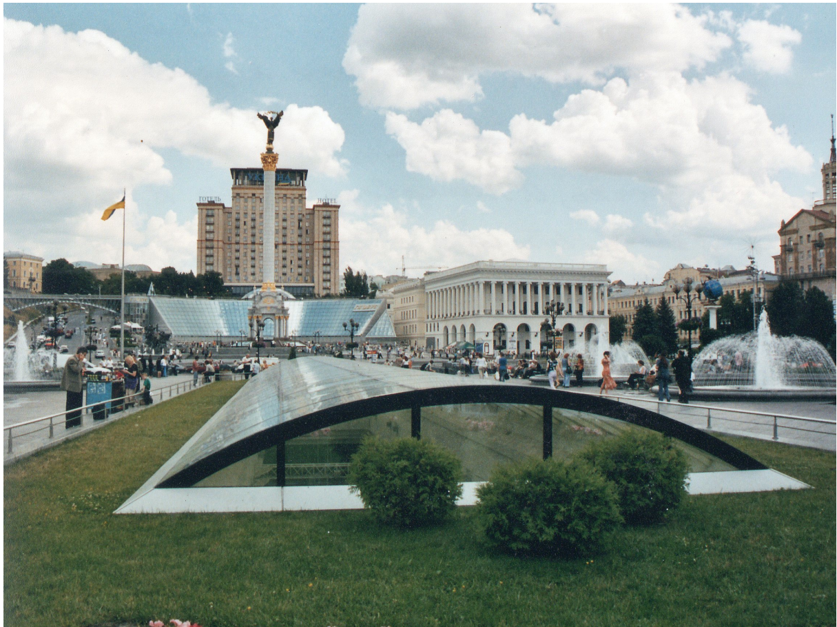
Fig. 6. Place de l'Indépendance. Photographie des années 2000.

Après les festivités, les travaux se sont poursuivis par l'aménagement d'un grand centre commercial souterrain, "le Globe", recouvert d'une énorme verrière destinée à éclairer ses boutiques, réparties sur plusieurs niveaux 40 . Toute la place a été parsemée de gazon et ornée de sculptures allégoriques, de bassins, de mobilier urbain de styles divers et de formes variées dont l'ensemble ne donne pas l'impression d'un système cohérent et réfléchi (Fig.6).