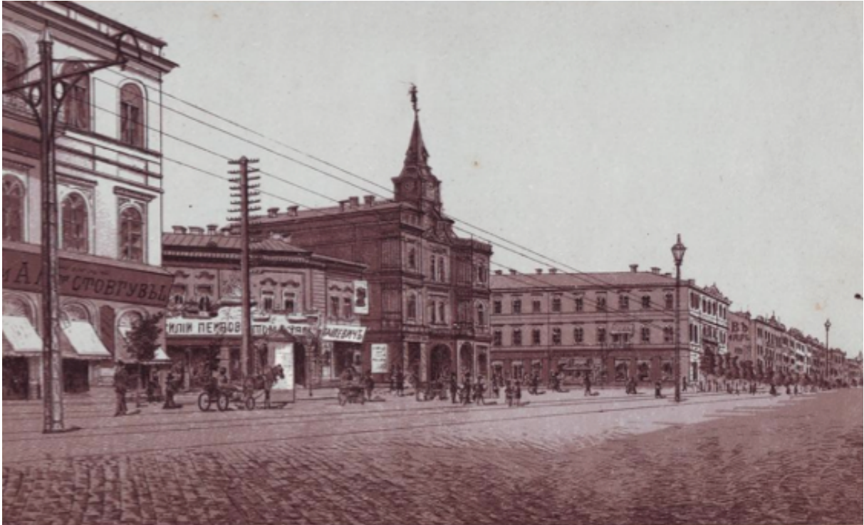
Fig.1. La place de la Duma à la fin du XIXe siècle. Ancienne carte postale.

À la fin du XIX e siècle à l'arrière de l'édifice de la Duma est aménagée une place circulaire avec un square dans sa partie centrale, agrémenté en 1908-1909 par une immense fontaine ornementale en fonte (démontée en 1981). En 1913, devant le bâtiment de la Duma est érigé un monument à P. Stolypin (sc. E. Ximenes), mortellement blessé à l'opéra de Kiev en septembre 1911. Ce monument reste en place jusqu'en mars 1917. Aujourd'hui, quelques immeubles de « style moderne » (variante locale de l'Art Nouveau) et de style néoclassique conservés entre la place de l'Europe et la place de l'Indépendance donnent une idée de l'aspect architectural de la place avant la Première Guerre mondiale.