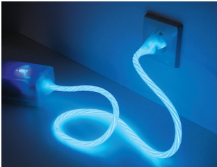
Figure 2: Power AWARE Cord [8].