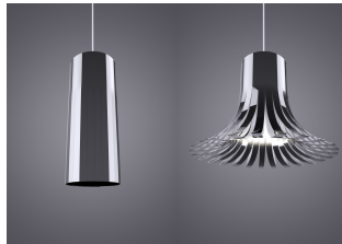
Figure 3: Flower Lamp [1].

numérique ; son apparence indique sa signification, sa fonction et comment interagir avec [20-5, 24-4].