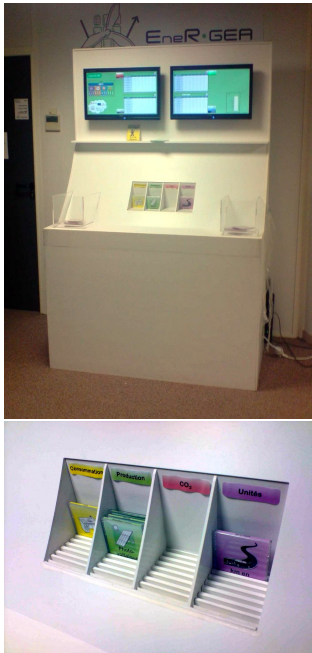
Figure 4: StationENR [19].

le hall du lieu cible, utilisant la manipulation d'accessoires tangibles (cartouches [22]) pour combiner et recombinaer les modélisations possibles afin de sensibiliser les utilisateurs d'un espace collectif aux problématiques de production, stockage et consommation des énergies renouvelables. Nous ne pensons pas que cette sous-représentation soit due à la disparition possible des interacteurs sur les espaces collectifs, car ceux-ci peuvent être équipés de puces avertissant de leur éloignement de l'interface, mais plutôt parce que cette voie n'a pas été explorée.