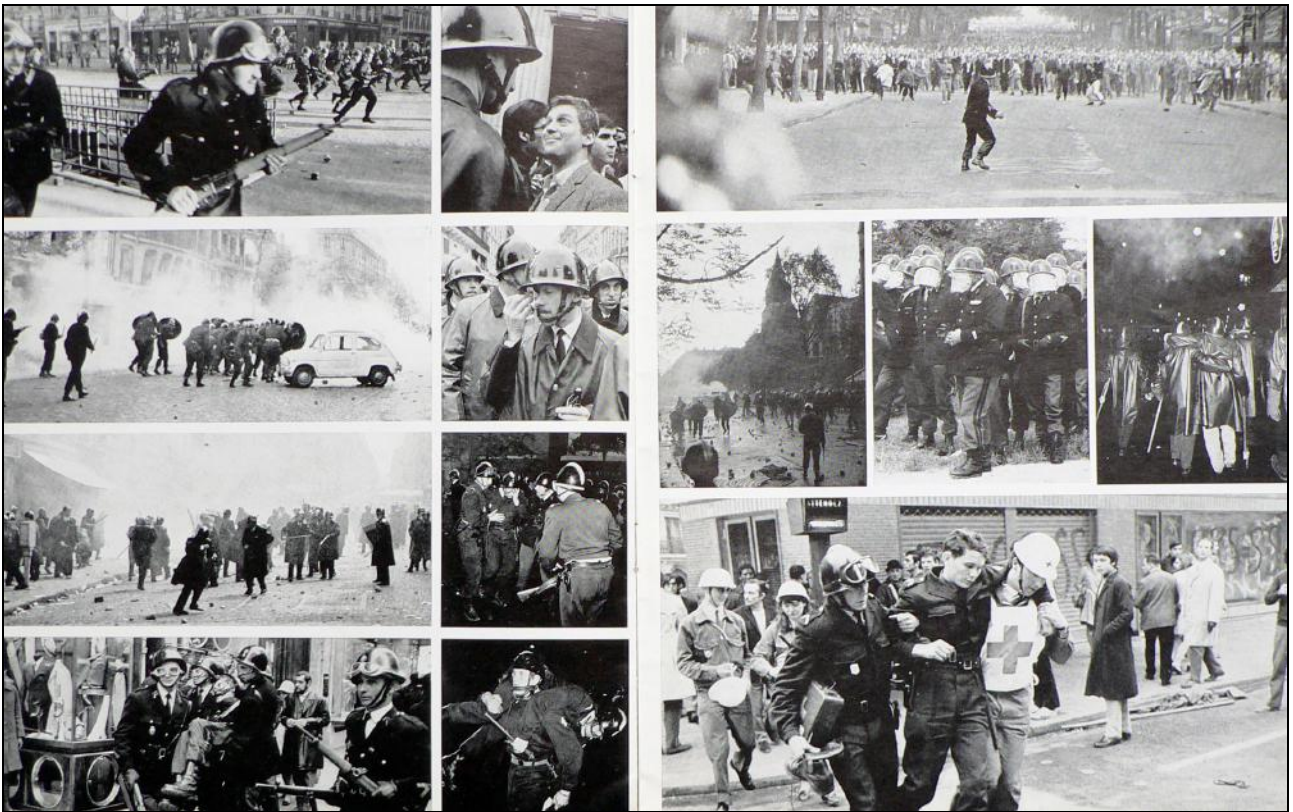
[Fig. 05] Journalistes Reporters Photographes n° 15, mois de juin 1968.

Dans le numéro spécial de fin d'année des rédactions, le corpus d'images de Caron et leur proportion ne varient pas 17 . Ainsi, sa consécration comme LE photographe de Mai 68 pour les seules qualités documentaires et formelles de ses photographies ne résiste pas à l'analyse des publications de l'époque. Leur persistance comme forme visuelle des événements et leur statut d'icônes impliquent d'autres éléments culturels postérieurs.