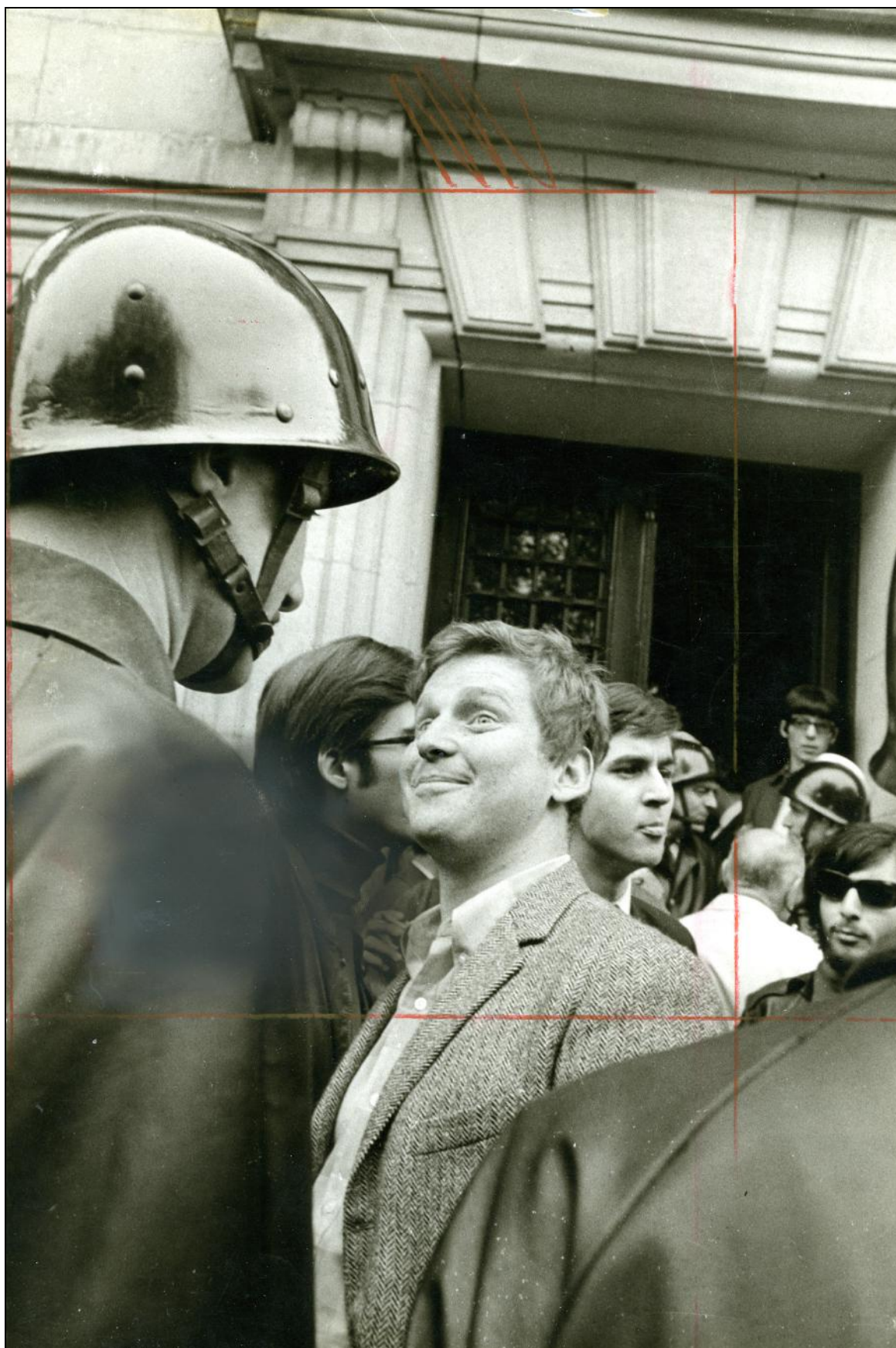
[Fig. 01]_Tirage de presse édité, Gilles Caron, 6 mai 1968, Paris. Archives Fondation Caron.