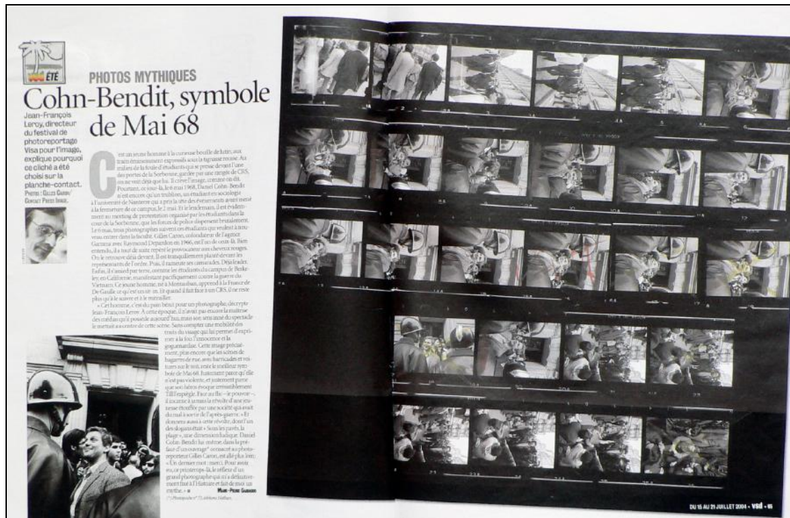
[Fig. 09]_ VSD n°1403 du 15-21 juillet 2004.

symbole de Mai 68 68 ». Des traces succinctes d'editing non datées confirment implicitement la sélection de la photographie à l'époque des événements.