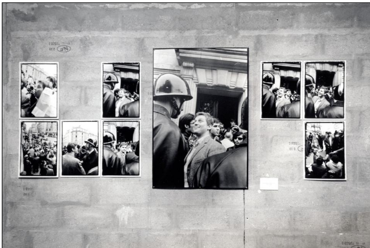
[Fig.08]_Exposition « Gilles Caron. Plutôt la vie », Manufacture des Œillets, Ivry-sur-Seine, 1998.

de Cohn-Bendit par Haillot se multiplient 64 ; des séquences de ce face-à-face montrent succinctement les coulisses de la prise de vue 65 .