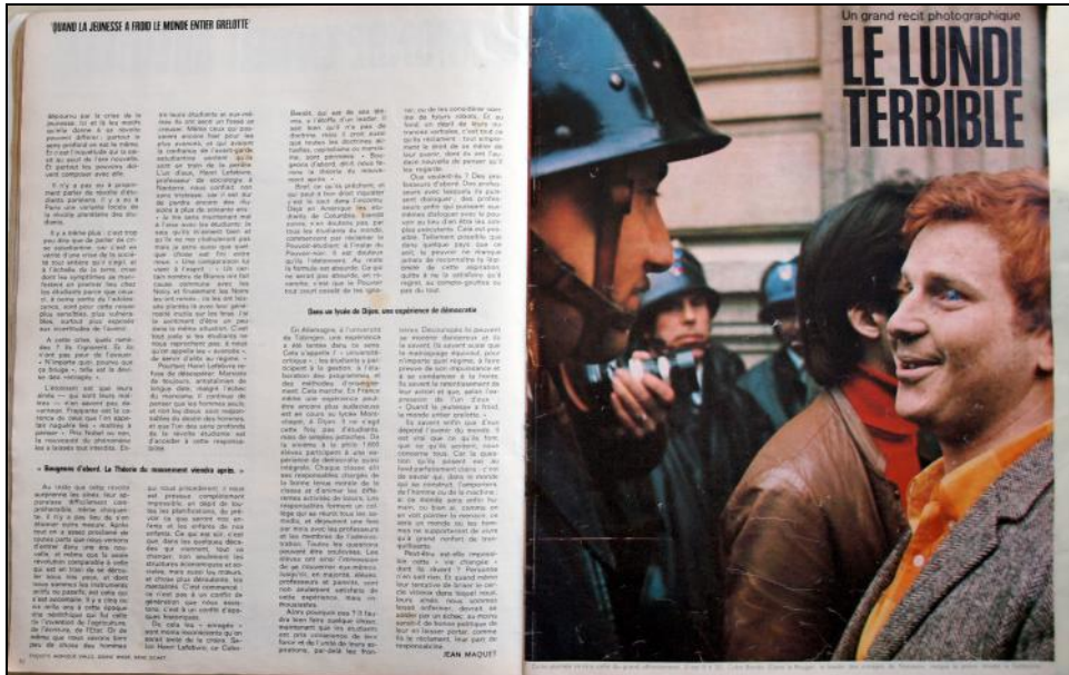
[Fig. 04]_Paris Match n° 997, 18 mai 1968. Photographie couleur Georges Melet.

La version par Caron, aujourd'hui célèbre, paraît discrètement dans Journalistes, Reporters, Photographes n° 15 (revue de presse spécialisée, confidentielle au milieu professionnel), dans un numéro tardif au plus tôt du 15 juin et consacré à la moisson exceptionnelle de photographies des événements : elle n'est pas publiée comme document d'actualité dans la presse d'information au printemps 1968.