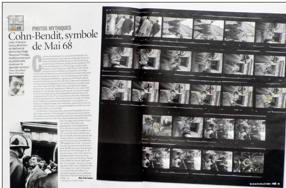
[Fig. 09]_ VSD n°1403 du 15-21 juillet 2004.

symbole de Mai 68 68 ». Des traces succinctes d'editing non datées confirment implicitement la sélection de la photographie à l'époque des événements.