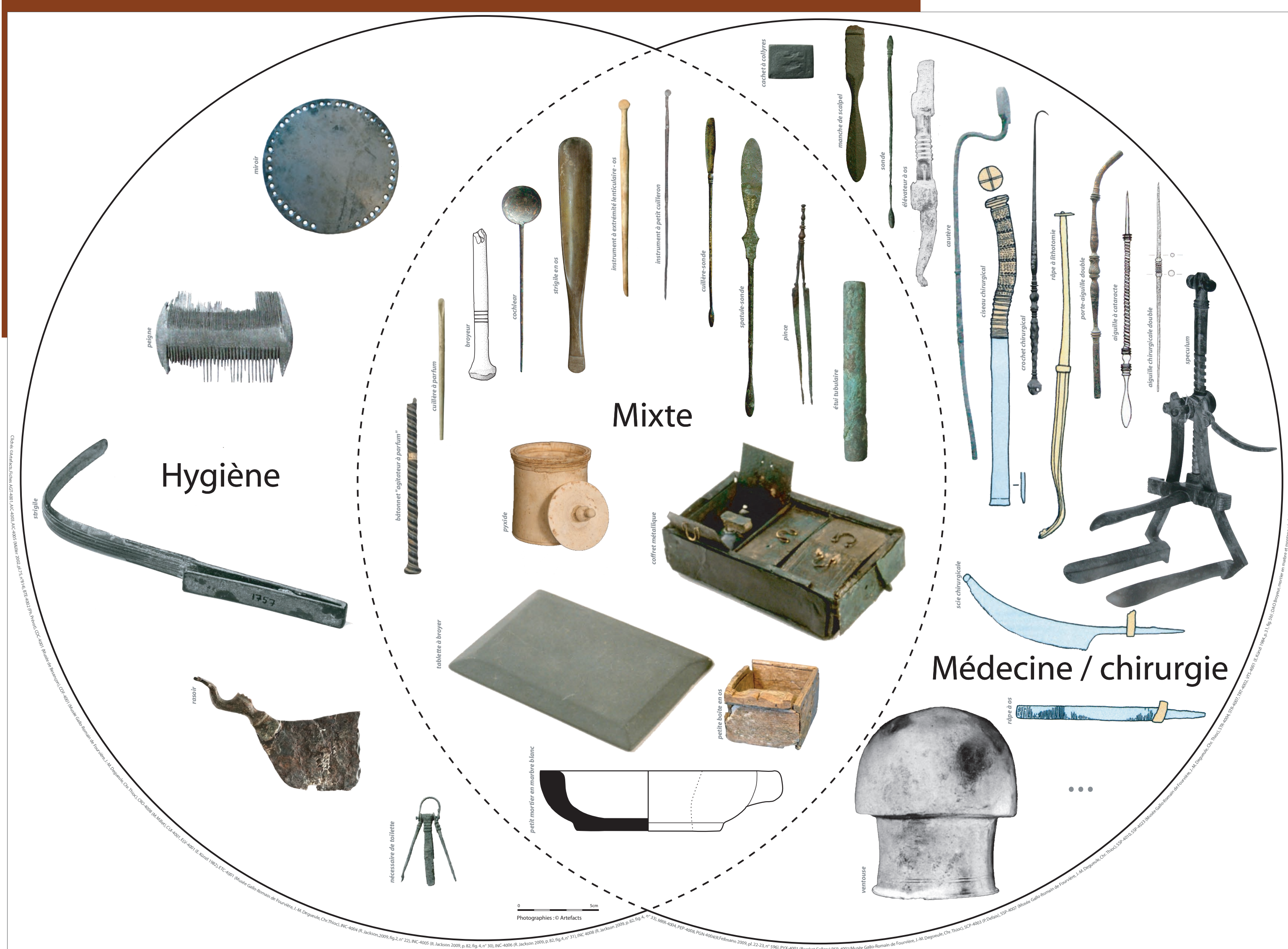
fig. 2 - Tripartition des catégories fonctionnelles

Le corpus a été réalisé à partir de sources matérielles et textuelles sur l'ensemble de la Gaule romaine. Il intègre les données du 1er s. av. J.-C. à l'Antiquité tardive.