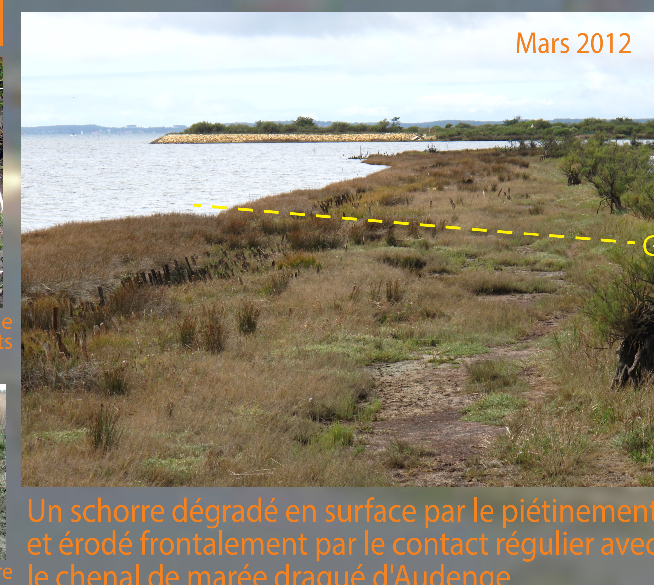
Un schorre dégradé en surface par le piétinement et érodé frontalement par le contact régulier avec le chenal de marée dragué d'Audenge

Etagement et dynamique successionale des groupements végétaux le long du transect Gr.VII