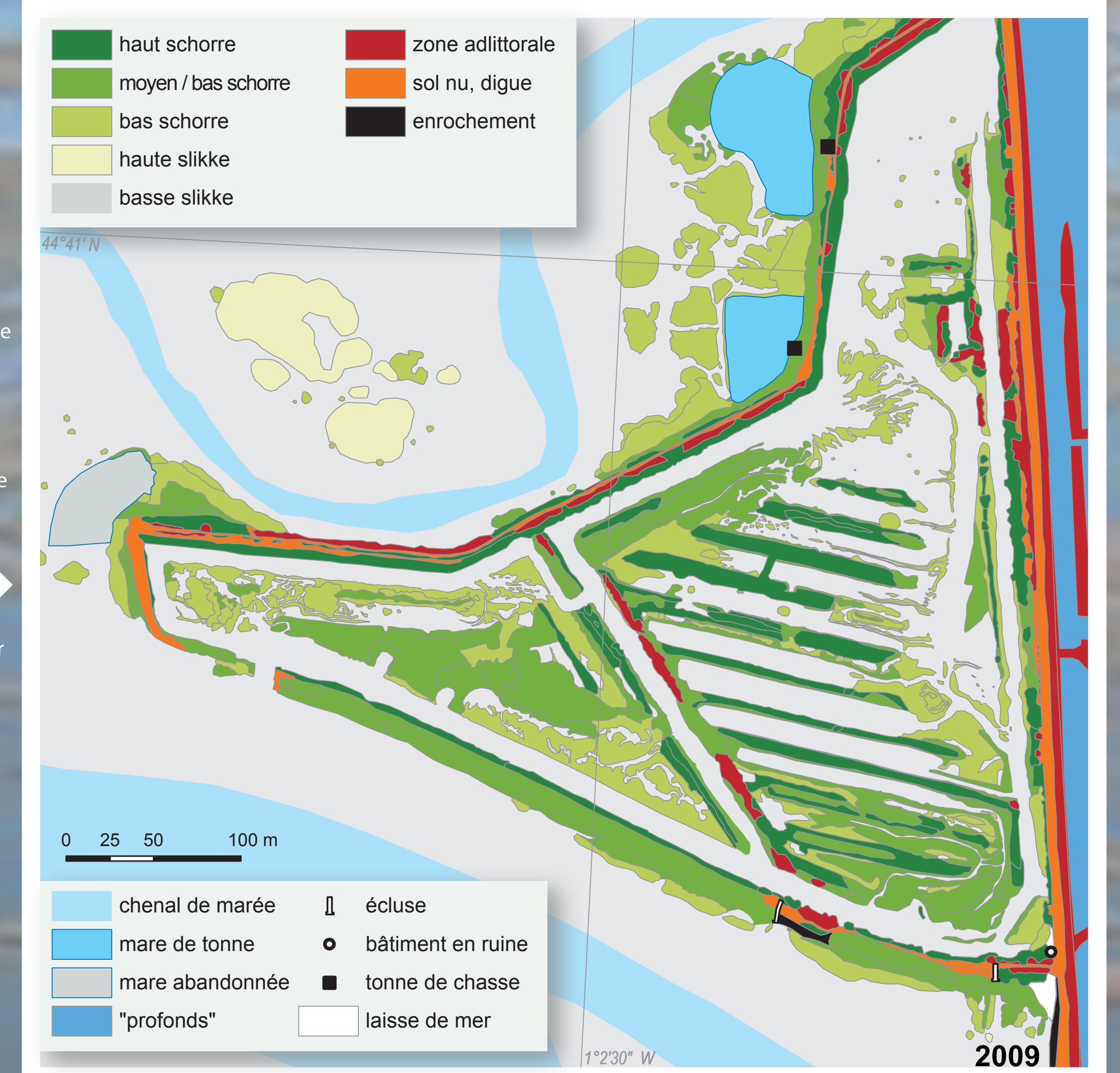
Une mosaïque de groupements disposés de manière fractale suivant la trame des aménagements

Subdivision bionomique de l'estran par analyse spatiale des données topographiques (DGPS, LIDAR) et regroupement des habitats au niveau 4 de la classification