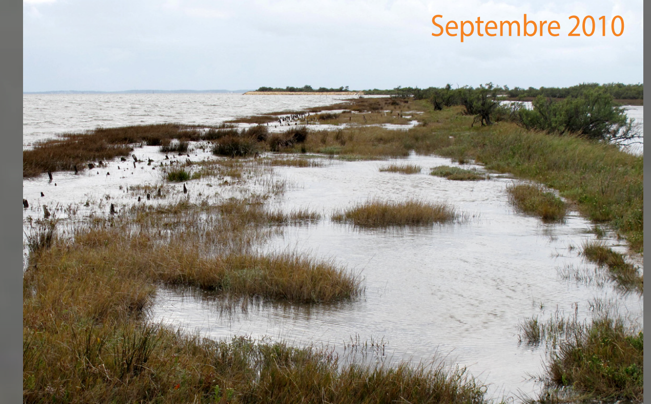
Atténuation du clapot par la jonchaie maritime (à gauche) et rétention des eaux favorisant la décantation à marée montante (1h avant PM, coef.102)

Des successions rétrogradantes dominent dans les parties externes du site à la faveur de l'érosion du front de schorre et du rehaussement de sa surface par le dépôt d'une partie des sédiments. La remontée des Spartines et le développement de l'Aster correspondent à une rétrogradation de la haute slikke et du bas schorre sur le moyen schorre tandis que les dynamiques d'extension végétative de l'Obione et du Chiendent du littoral participent d'une progradation de schorre moyen et du haut schorre en sens inverse. La rugosité du marais induite par le téléscopage des groupements végétaux, en particulier des prairies "remontantes" à Jonc maritime et de prairies "descendantes" à Chiendent du littoral favorise la dissipation de l'énergie du clapot et de la marée à l'échelle de l'ensemble du site.