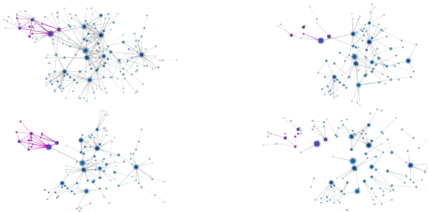
FIGURE 4: Représentation simultanée des différents couches du réseau : liens réseau (haut/gauche), liens financiers (bas/gauche), lien de connaissance (haut/droite), lien de sang (bas/droite).

Il est plus intéressant, et c'est dans cette direction que nos travaux nous emmènent, de comparer les liens entre chaque "couche" du réseau (?) (?) (?). L'apport de la visualisation est de faciliter l'exploration des données en autorisant la formulation de requêtes dynamiques. Il devient possible, par exemple, de rechercher la position dans la couche constituée des liens financiers d'acteurs d'un même cercle familial, ou encore de chercher à voir si les liens de connaissances sont orthogonaux aux tractations financières ou aux liens de réseau.