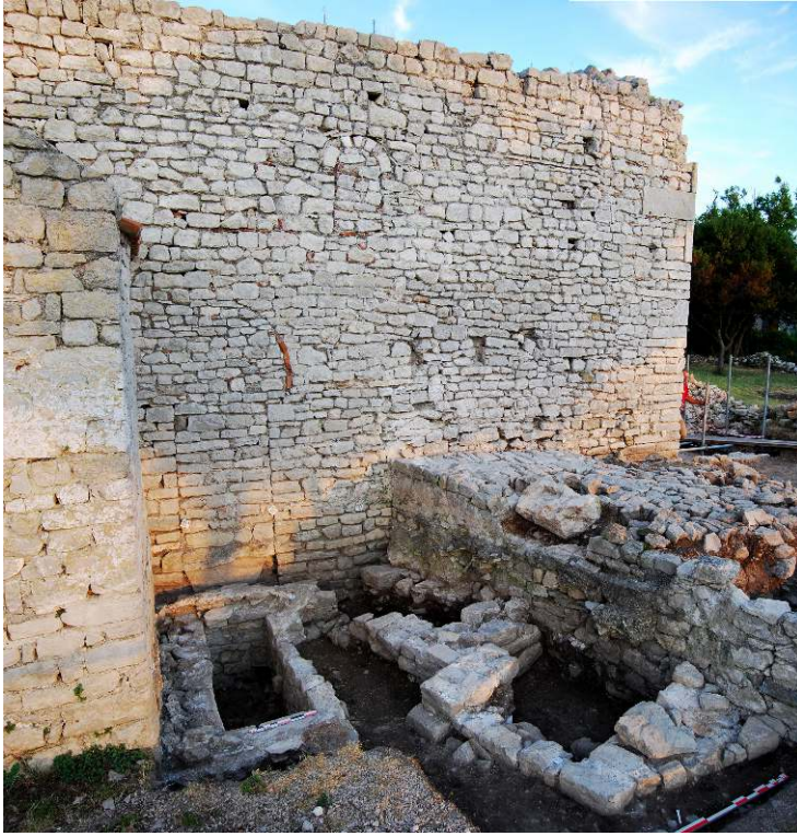
Fig. 12 – Caveau maçonné en situation privilégiée devant le passage roman et mur oriental du bâtiment, avec son escalier, adossé à l'église.