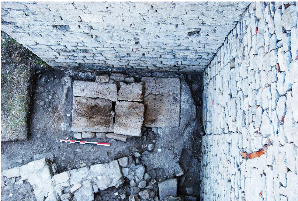
Fig. 13 – Vue zénithal du caveau avant son ouverture.