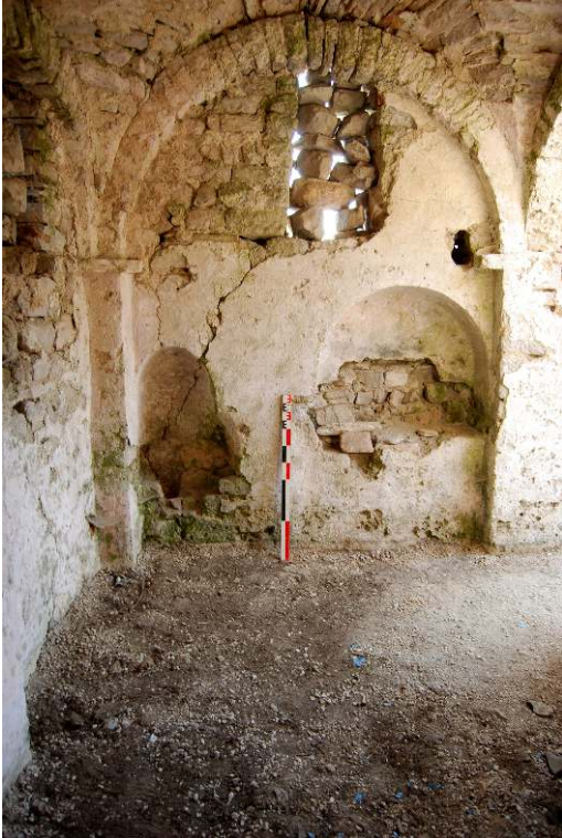
Cl. V. Chevassu.