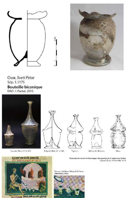
Fig. 3 – Dessin et cliché de la bouteille biconique de Saint-Pierre d'Osor et découvertes comparatives en Croatie et Serbie.