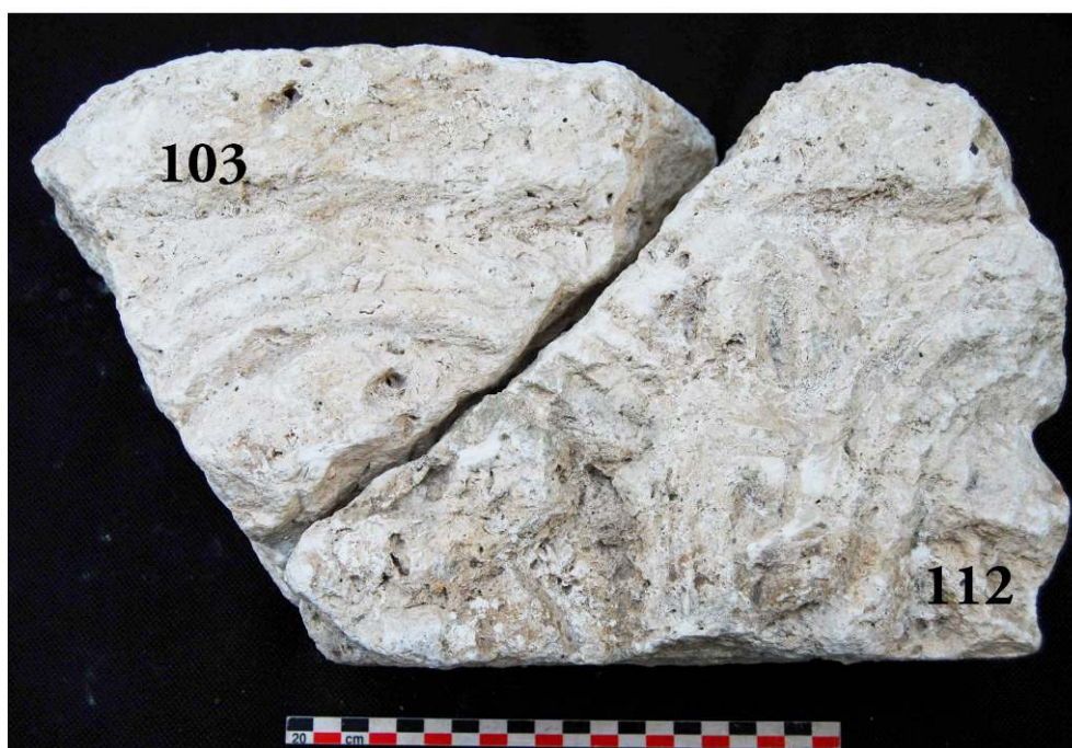
Fig. 15 – Fragments de plaque de chancel ou d'architrave décorée d'entrelacs et de motifs végétaux, fin VIII e -IX e s.