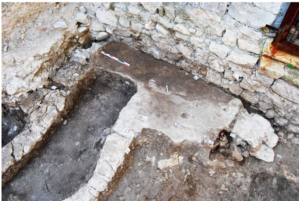
Fig. 4 – Vestiges de la façade de l'église antérieure et de son entrée.

antérieurs). Recoupé dans son épaisseur, on conserve seulement le parement interne de la façade sur quelques dizaines de cm de longueur.