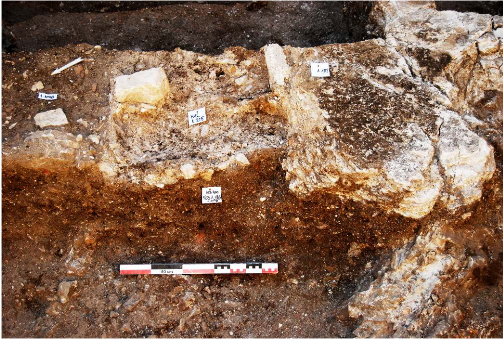
Fig. 5 – Détail du sol de la première église, limité par une structure maçonnée, non fondée : emmarchement ?