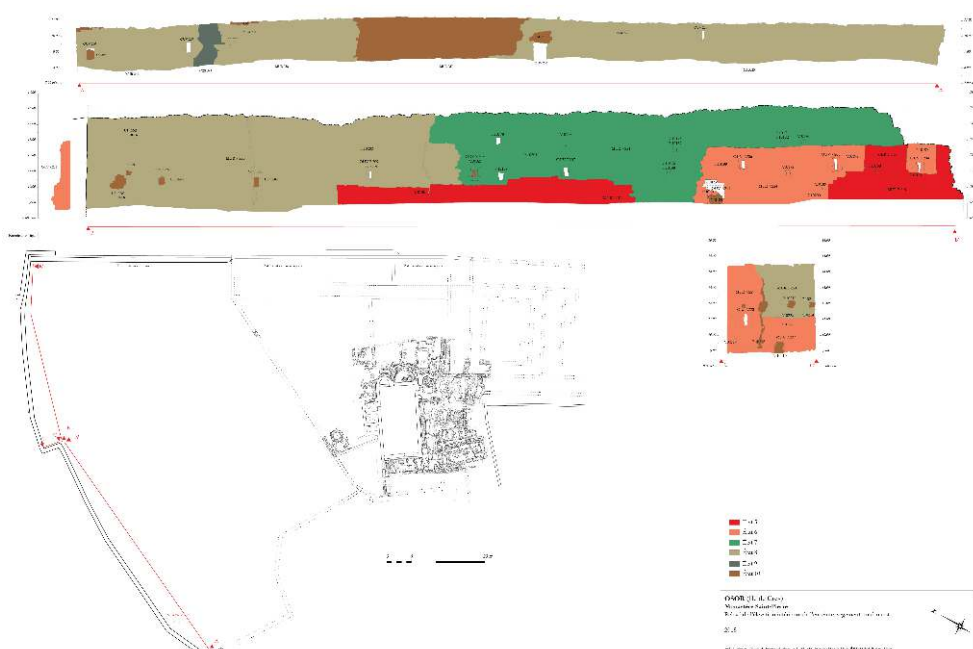
Fig. 16 – Relevé des élévations intérieures du segment nord-ouest de la muraille.