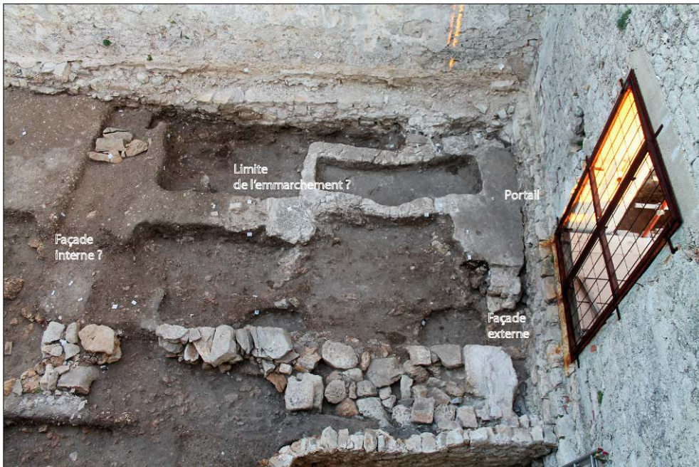
Fig. 6 – Vestiges des façades de la première église.