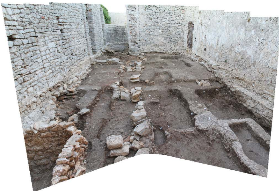
Fig. 1 – Vue générale de l'église réduite à l'achèvement de la fouille.

phasage complexe des élévations et de constater la présence d'une phase antérieure au XI e siècle au niveau de l'annexe nord (sacristie- memoria ). Une première tranchée de sondage avait également été ouverte en 2006, révélant les vestiges du mur-stylobate nord de l'église du XI e siècle. Le sondage avait alors démontré que l'espace intérieur de l'actuelle église Saint-Pierre – qui correspond à l'église réduite – avait été fortement perturbé par des sépultures du bas Moyen Âge et de l'époque moderne. Les sols les plus récents ont été détruits par la mise en culture de la surface de l'église à l'époque contemporaine.