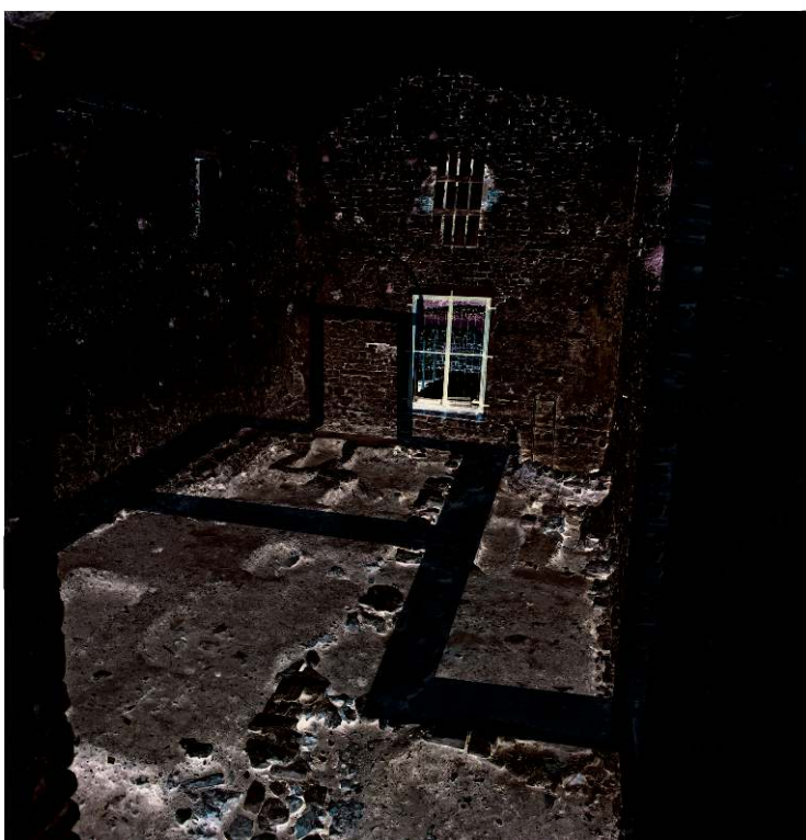
Fig. 7 – Restitution partielle du plan de la première église.