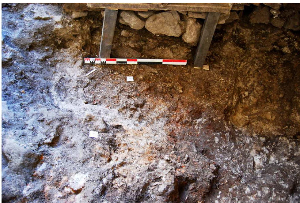
Cl. V. Chevassu.