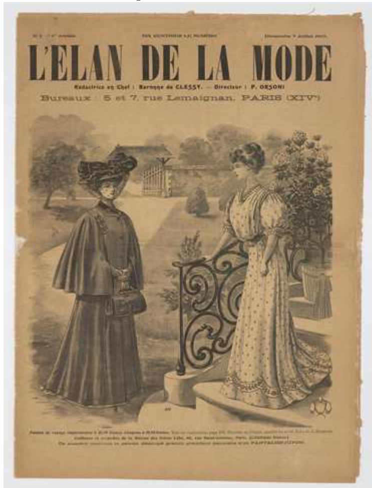
Fig. 2. Couverture de L'Élan de la Mode n° 1, 7 juillet 1907, coll. part.