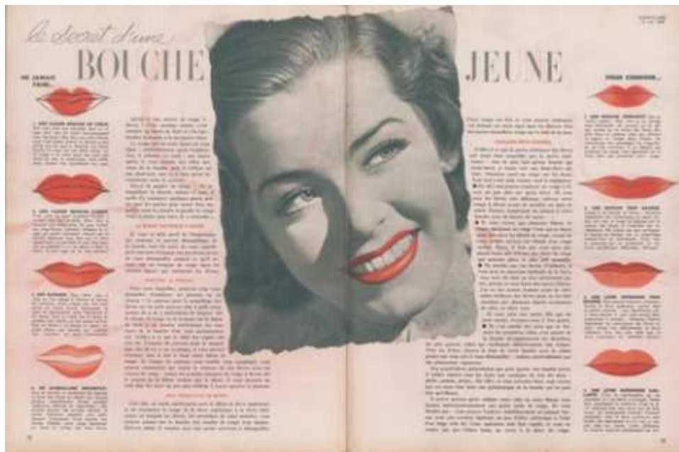
Fig. 7. Pages 38 et 39 de Marie-Claire n° 63, 13 mai 1938, article « Le secret d'une bouche jeune », coll. part.