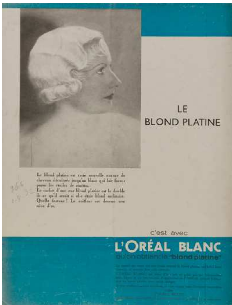
Fig. 4. Publicité pour la teinture L'Oréal blanc, quatrième de couverture de Beauté, coiffure, mode n° 266, 1er avril 1932, coll. bibliothèque Forney / Roger-Viollet, Paris.