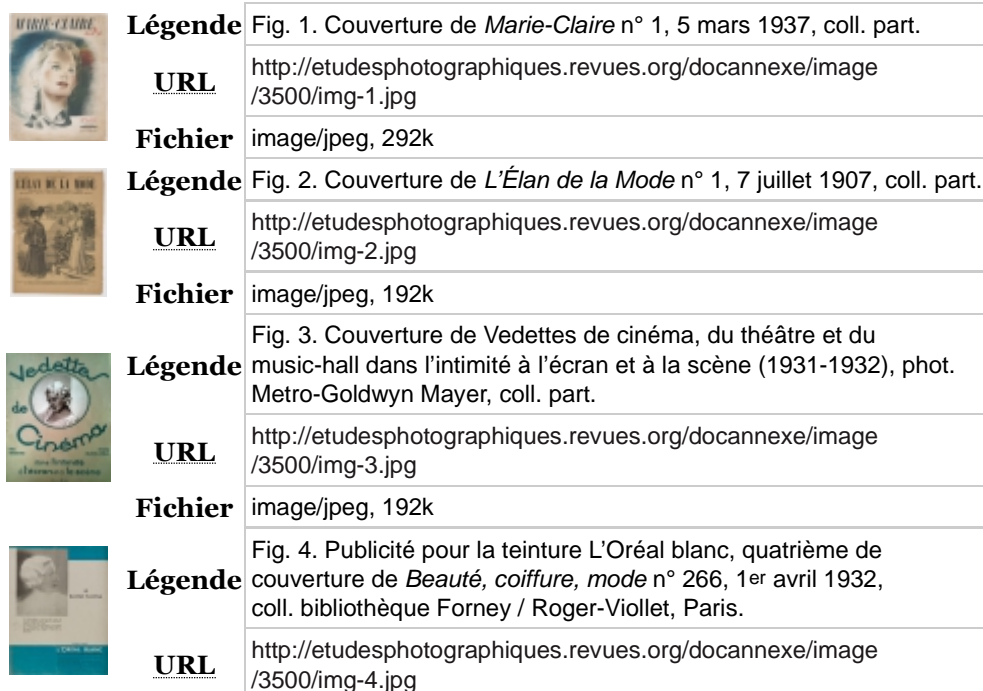
Table des illustrations

52 Éric MACÉ, Éric MAIGRET, Penser les médiacultures. Nouvelles pratiques et nouvelles approches de la représentation du monde , Paris, Armand Colin, 2005.