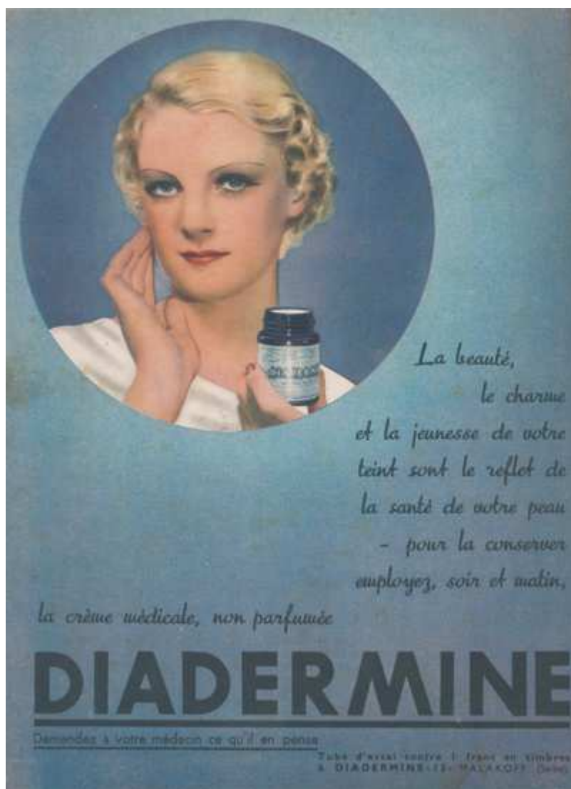
Fig. 8. Publicité pour Diadermine, quatrième de couverture de Marie-Claire n° 33, 15 octobre 1937, coll. part.