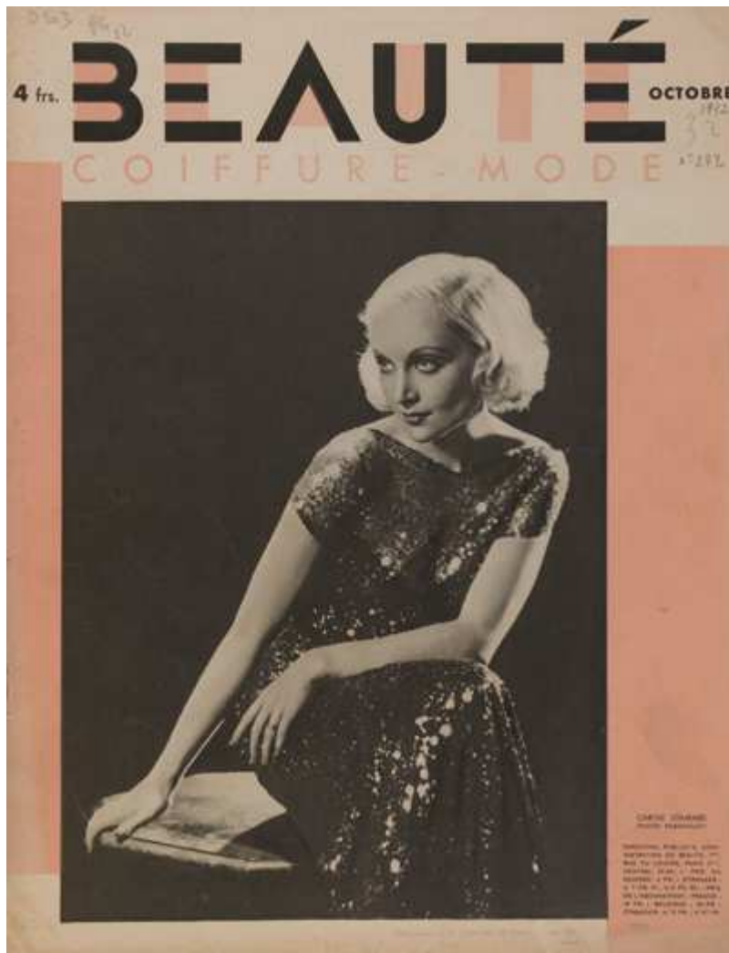
Fig. 5. Couverture de Beauté, coiffure, mode n° 272, octobre 1932, phot. Paramount, coll. bibliothèque Forney / Roger-Viollet, Paris.