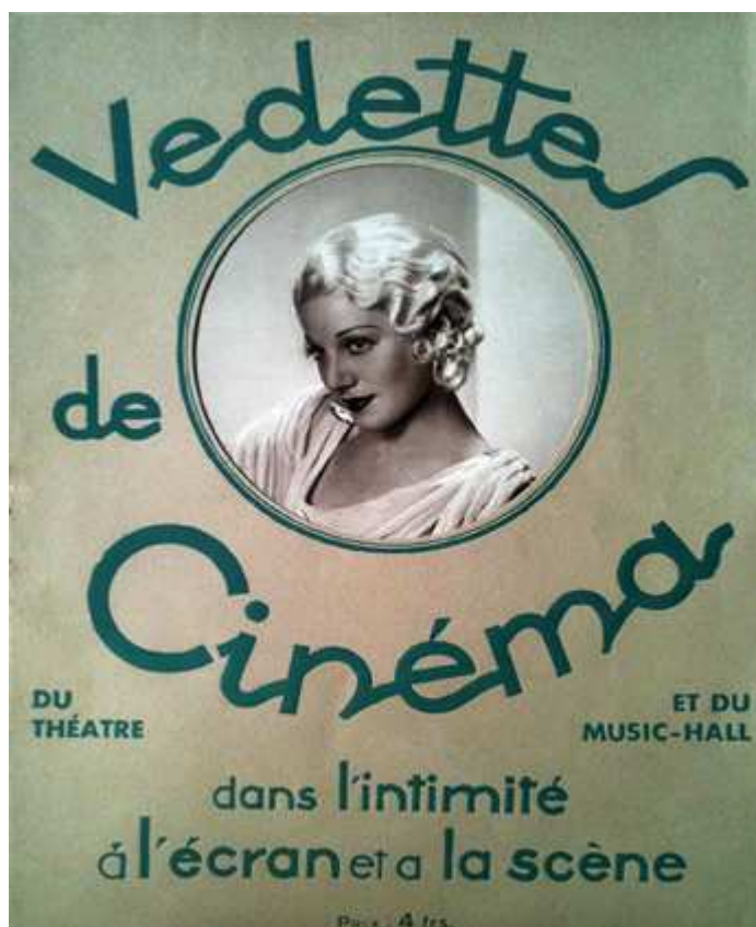
Fig. 3. Couverture de Vedettes de cinéma, du théâtre et du music-hall dans l'intimité à l'écran et à la scène (1931-1932)