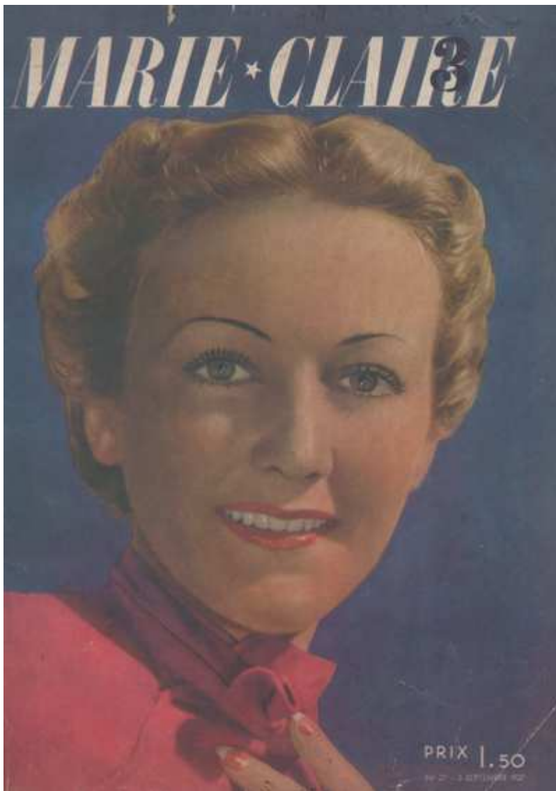
Fig. 6. Couverture de Marie-Claire n° 27, 3 septembre 1937