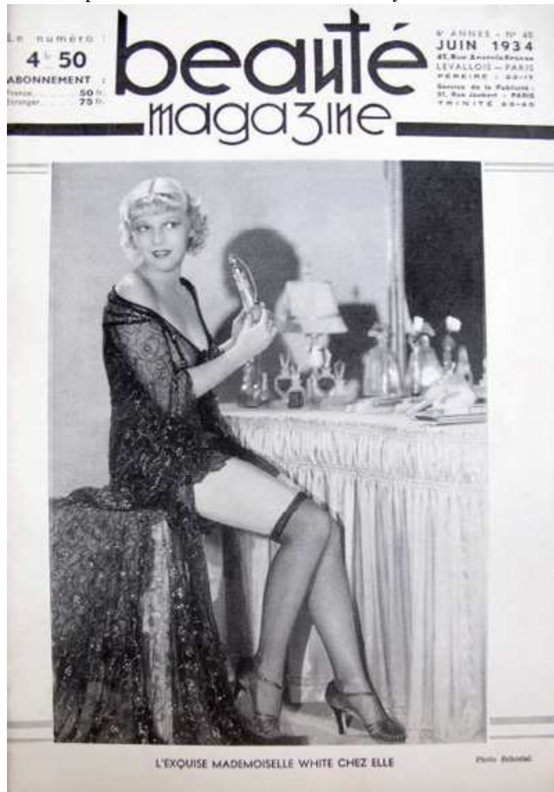
Fig. 9. Deuxième couverture de Beauté magazine n° 40, juin 1934

sur la coopération masculine dans ce nouveau système.