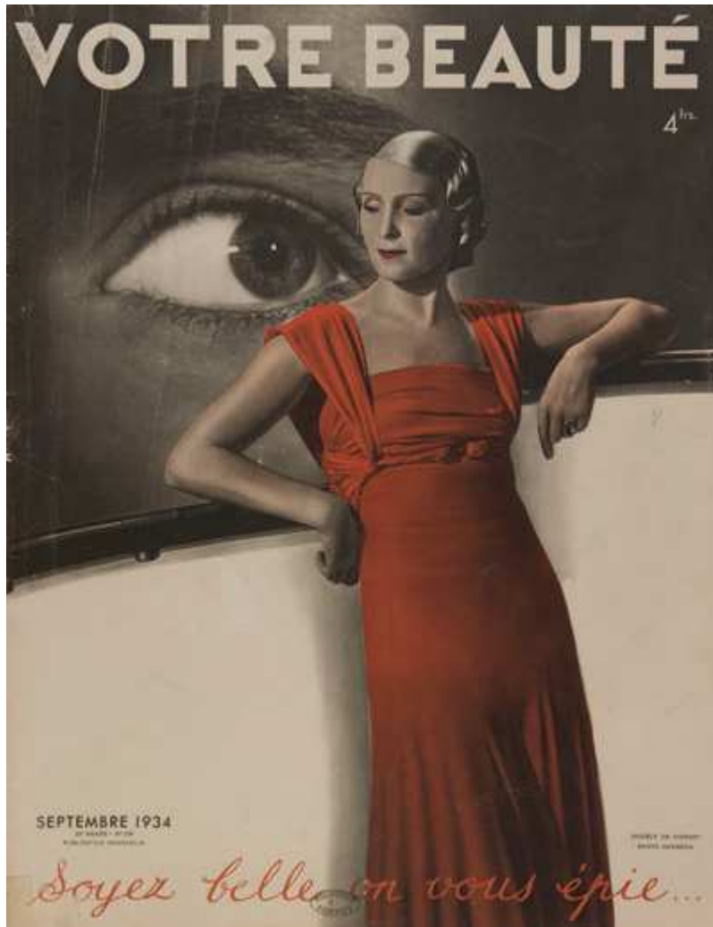
Fig. 10. Couverture de Votre Beauté n° 295, septembre 1934, phot. Meerson, coll. bibliothèque Forney / Roger-Viollet, Paris.

« fraternel » et plus égalitaire 47 . En parallèle, une partie des féministes énonce la volonté d'une réappropriation du plaisir des femmes par elles-mêmes face à une sexualité relativement décevante 48 . Cependant, si cette cristallisation du couple autour de l'amour conjugal trouve des racines dans le XIX e siècle, elle semble s'affirmer et se diffuser dans les couches les plus modestes de la société entre les années 1920 et le début de la Seconde Guerre mondiale 49 . Dans ce contexte, le paradigme de la star féminine est celui d'une femme moderne, qui s'approprie sa sexualité en maîtrisant son apparence et son potentiel de séduction. Il encourage l'évolution des rapports entre maris et épouses en proposant un modèle positif de féminité.