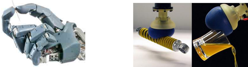
Figure 3 : A gauche la main du DLR, à droite celle de l'université de Cornell 25 : quelle est la plus simplexe ?

l'apparition chez les primates du pouce opposable aux quatre doigts de la main a trait à la conception d'une forme qui a grandement « simplifié » la préhension.