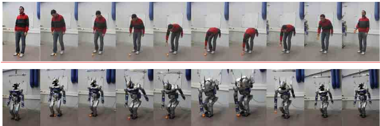
Figure 4 : Le corps tout entier participe à l'action de saisie.