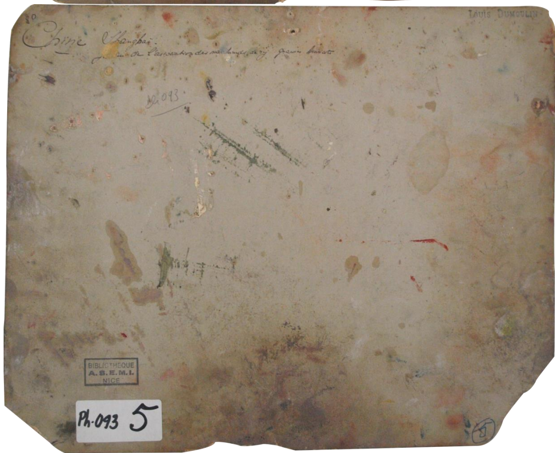
PH93-5 : Date et auteur inconnus. Epreuve à l'albumine sur papier, montage sur carton « Chine. Shanghai. Jardin de la Société des marchands de riz graines haricots » (annotation de Louis Dumoulin au dos du montage)