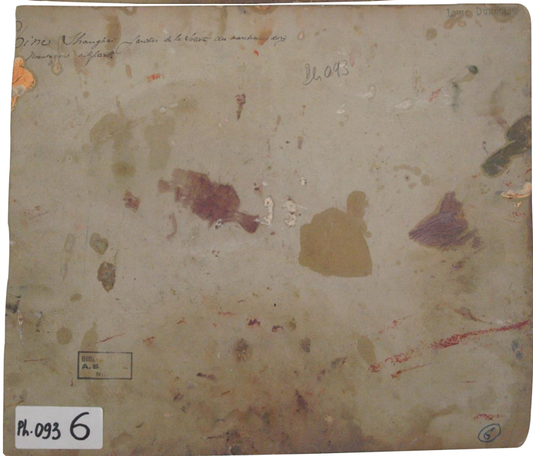
PH93-6 : Date et auteur inconnus. Epreuve à l'albumine sur papier, montage sur carton « Chine. Shanghai. Jardin de la Société des marchands de riz. Montagne artificielle » (annotation de Louis Dumoulin au dos du montage)

Un autre exemple ci-dessous dans la collection Japon de Dumoulin, à gauche une photographie de sa collection qui a servi de modèle au tableau de droite intitulé « Fête des garçons » (tableau réalisé en 1888