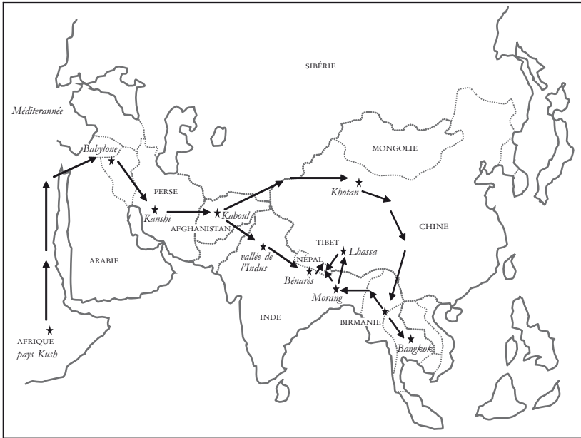
CARTE I — Représentation cartographique de l'immigration kirant (modifié d'après J. R. Subba 1999)

Ce schéma illustre la vision centrée sur l'origine extérieure du groupe kirant, qui est montré comme ayant traversé toute l'Asie avant de se retrouver en Himalaya. Elle innove par rapport à Chemjong en ce que l'origine du groupe n'est plus Israël, mais l'Afrique noire. Il s'agit certainement d'une volonté de mise en adéquation des vues de Chemjong avec la théorie «scientifique», qui veut que l'Afrique soit le berceau de l'humanité.