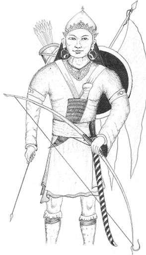
ILL. 1 — Représentation de Yelambar, roi de la dynastie Kirâta (dessin G. Schlemmer)

Yelambar est supposé être l'un des premiers roi kirant. Il interviendrait dans l'épopée du Mahâbhârata , parmi lesdits «Kirâta». Ce dessin mêle des éléments indo-népalais (le port de la couronne sripec , la forme du drapeau, le caractère guerrier du roi kshatrya ) avec des aspects spécifiquement kirant (les traits «mongoloïdes» de son visage et le port de l'arc, qui est devenu l'emblème des associations ethniques rai et limbu).