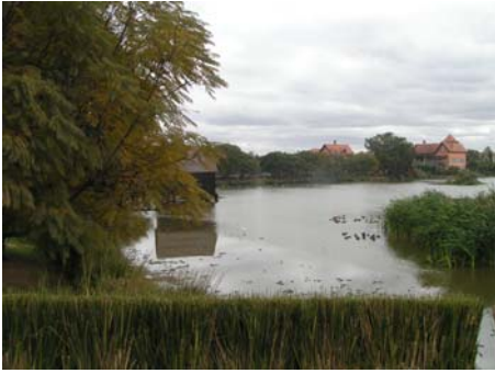
photo 3a. Le Tana Waterfront : le marécage transformé en lac paysager... Catherine Fournet-Guerin, 2011