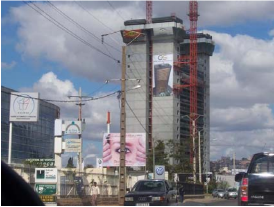
photo 4. La « Tour Orange » en construction sur la route des hydrocarbures. La plus grande tour de la ville.