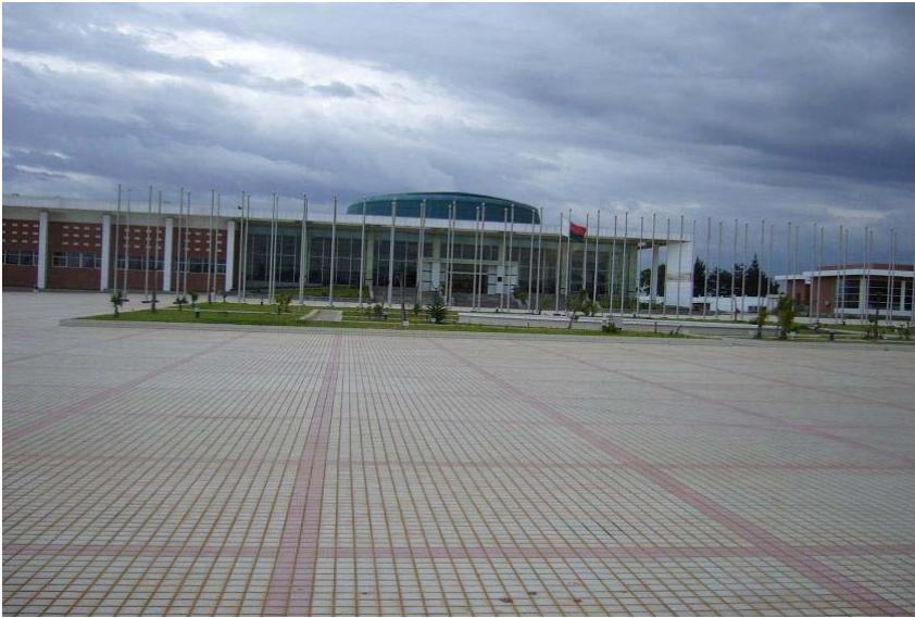
photo 1. Le CCI construit pour le sommet de l'Union africaine en 2009. Catherine Fournet-Guerin, 2011

le grand hôtel joutant le CCI, une tour élancée, est quant à lui resté fermé en raison de son inachèvement. Il fait figure d'éléphant blanc du sommet annulé de l'UA (photo 2).