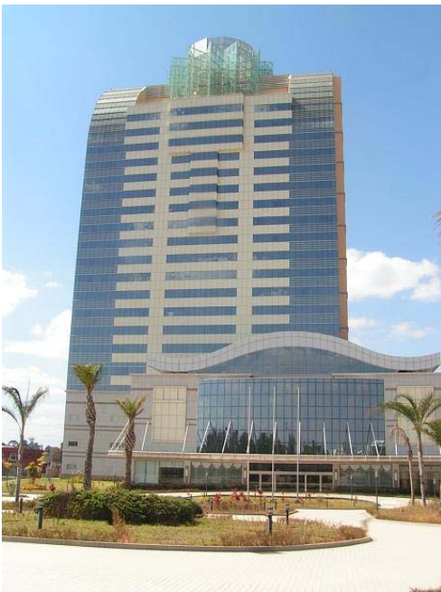
photo 2. L'hôtel voisin jamais achevé. « L'éléphant blanc » d'Antananarivo. Catherine Fournet-Guerin, 2011

A ces constructions impulsées par l'Etat, il est possible d'ajouter d'autres dynamiques spatiales qui confortent le développement de ce pôle : l'ambassade des Etats-Unis, après avoir été localisée depuis 1960 dans le centre-ville d'Antananarivo, a ouvert en 2011 en périphérie, sur la route d'Ivato, à quelque dix kilomètres du centre. D'autres installations aux alentours d'Ivato vont dans le sens d'un développement d'une nouvelle centralité, telles l'une des quatre écoles françaises de la ville, l'école américaine, un grand