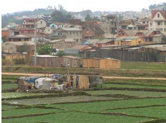
photo 3 b. La vue depuis le Tana Waterfront sur les habitats précaires environnants.

L'une des autres conséquences paysagères identifiées de la métropolisation est la construction de tours. A Antananarivo, il n'existe que très peu d'immeubles de plus de dix étages : l'hôtel Carlton, anciennement appartenant à la chaîne internationale Hilton, un immeuble de bureaux accueillant jadis le siège de la compagnie pétrolière malgache, la tour Zital en périphérie nord de la ville, proche de la route des hydrocarbures, toutes trois étant de taille relativement modestes. Or depuis 2010 est en construction la plus grande tour de la ville et du pays, le long de la route des hydrocarbures. Elle est provisoirement dénommée tour Orange, du nom de l'opérateur téléphonique français qui aurait assuré louer vingt étages du bâtiment une fois livré (photo 4). La tour Orange tranche par ses dimensions (trente-six étages) et par sa construction aux normes internationales, ce qui constituerait une première à Madagascar. La forte visibilité de cette tour en plaine suscite des réactions très controversées. De manière attendue, nombre de Tananariviens décrivent cette construction jugée laide et trop détonante dans le paysage urbain. Mais d'autres expriment leur satisfaction de voir s'édifier un bâtiment hardi, aux normes internationales, qui contribuera à faire de leur ville une « vraie ville », capable de rivaliser avec les plus grandes.