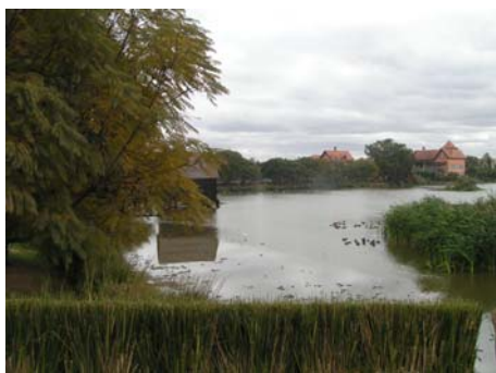
photo 3a. Le Tana Waterfront : le marécage transformé en lac paysager... Catherine Fournet-Guerin, 2011