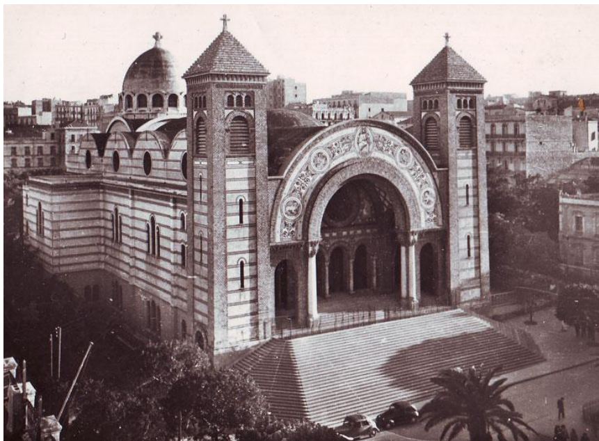
La cathédrale du Sacré-Cœur à Oran

lesquels il avait joué et chanté le même hymne au stade de football. Il ne comprend pas pourquoi maintenant tout n'est plus que décombres, débris, gravats et désolation. Il se souvient juste qu'avant 1961, « tout était propre ici » et que ces deux communautés – arabe et française – arrivaient, tant bien que mal, à vivre heureuses. Il se remémore cette date fatidique de 1961, date où la guerre divise définitivement les deux communautés et Oran devient un bastion de l'OAS. La ville n'échappera pas aux meurtres dans les quartiers européens et aux attentats dans les quartiers arabes.