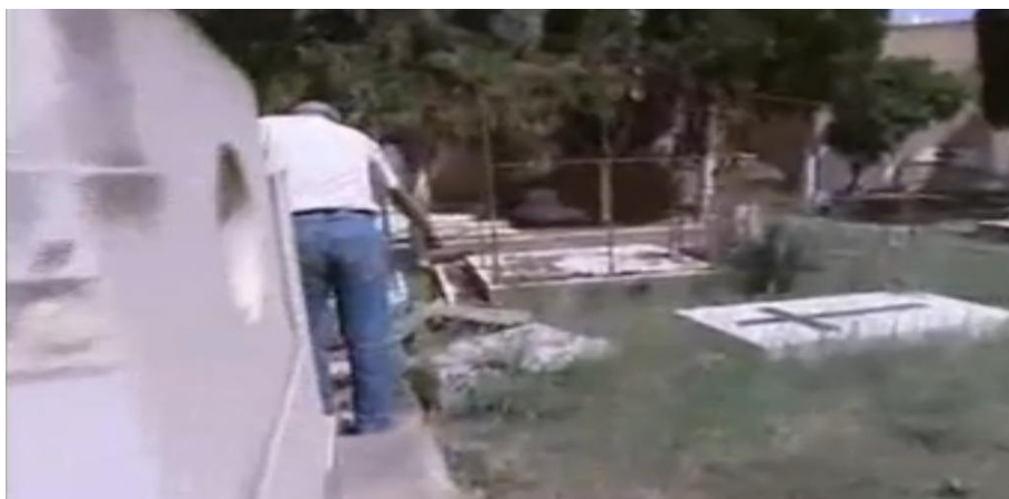
Le cimetière chrétien de Perrégaux