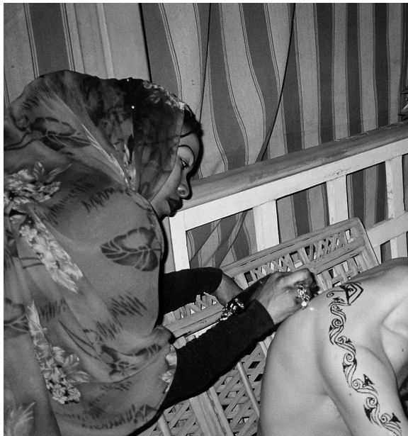
Tatoueuse au henné appliquant un motif pharaonique. Le Caire, 2005.

En 2004, j'avais remarqué, dans le grand souk du Caire, l'arrivée de femmes du Darfour qui gagnaient leur vie en tatouant les gens au henné dans les rues. Au même moment, de nombreux villages du Darfour brûlaient. Ces femmes avaient suscité ma curiosité en raison de leurs activités innovantes que j'observais pour la première fois. Aucune autre femme des diasporas africaines n'avait de telles occupations. Lorsque je décidai de consacrer un documentaire aux réfugiés du Darfour, j'avais déjà noté l'extrême courage dont ils faisaient preuve car, contrairement à d'autres communautés, ils n'avaient pas hésité à occuper des places très marginales sur le marché du travail. Leur visibilité était forte, les hommes vendaient sur les trottoirs des quartiers populaires, autour de la gare centrale du Caire, des objets en plastique en provenance de Chine à très bas prix. C'est ainsi, de manière très visuelle, que je repérai l'inscription des Four dans l'espace public égyptien. En « cinéaste », j'assistais à la mise en place des frontières et des métiers à une vitesse étonnante. En quelques mois, des stratégies commerciales s'étaient construites sur un principe de genre. Les hommes étaient négociants de rue et ouvriers dans la grande périphérie, où ils travaillaient dans les décharges au péril de leur vie, en manipulant des produits toxiques ; les femmes se rabattaient sur des espaces marchands laissés libres car dévalorisés par les codes de bonne conduite locaux.