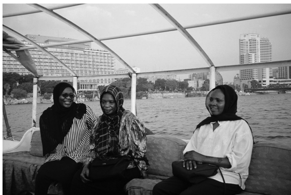
Les trois artistes au henné sur la felouque chantent Chocolata . Le Caire, 2005.

Les difficultés liées au travail sont surtout d'ordre raciste. Les filouteries et les insultes relèvent du comportement de la classe moyenne égyptienne à l'égard des noirs. Contrairement aux scenarii que l'on peut observer en Europe, l'émetteur de stigmates est assez naïf, quasi « bon enfant » dans sa façon de se moquer. Plusieurs scènes du film le mettent en évidence. Le déni social n'est ici pas réservé aux Soudanaises du Darfour, dont les clientes pour la plupart n'ont jamais entendu parler, mais serait identique pour les autres catégories jugées « inférieures », tels les Sayyidi de Haute-Égypte aux origines rurales encore fraîches. Les moqueries sont d'ailleurs comparables et visent la couleur de la peau (être foncé), l'accent et la manière de s'habiller. De nombreux films populaires et séries B égyptiennes font état de cette stigmatisation « douce » à l'encontre des ruraux ou des provinciaux 14 , auxquels la moquerie, même sur le ton de l'ironie, assigne une place définitivement « subalterne ».