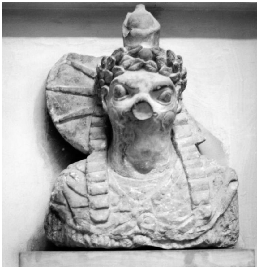
Fig. 6 Une statue parlante.

processions de la barque divine, trop exceptionnelle pour répondre aux attentes permanentes des fidèles et probablement trop coûteuse en une période de fort déclin économique des temples, cède ici la place, sans nécessairement disparaître pour autant, à une nouvelle technique rituelle. L'évolution de la relation du fidèle au dieu dans le sens d'une piété personnelle, amorcée en Égypte depuis le Nouvel Empire 91 , s'adapte à une curiosité que des individus comme Jamblique ont par la suite emblématisée 92 . La concurrence était par ailleurs forte avec