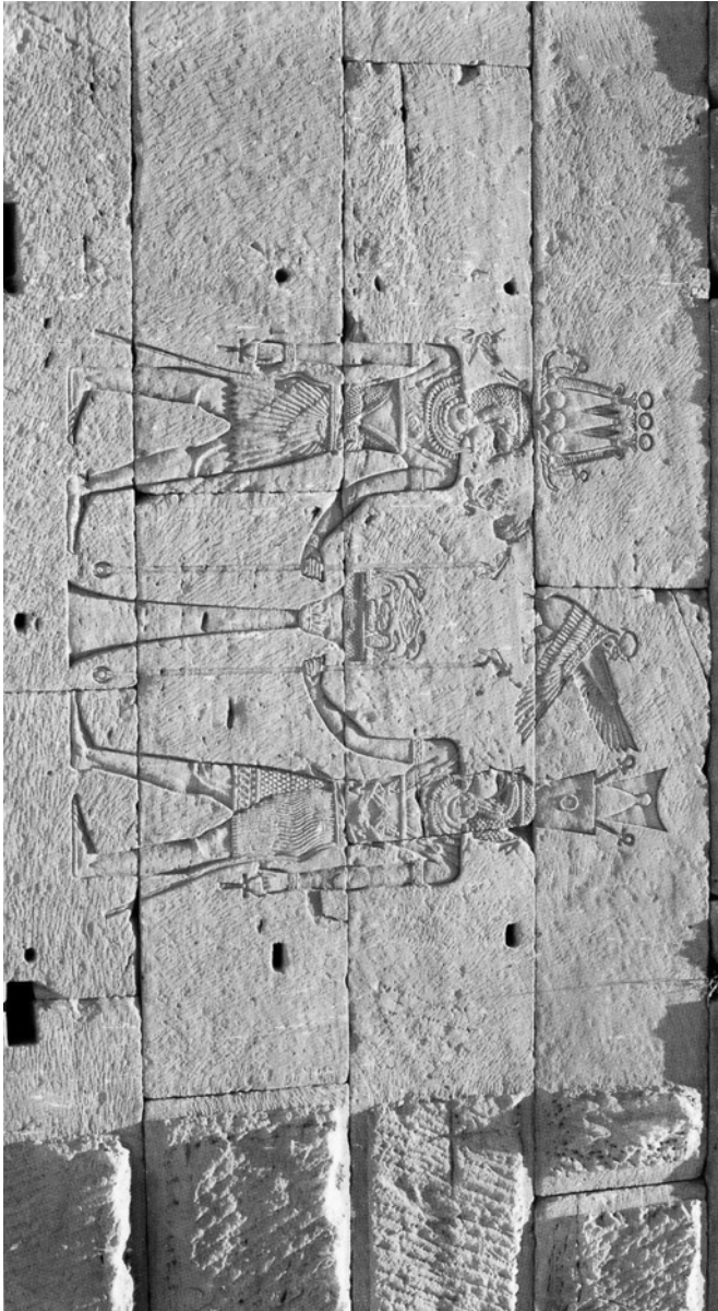
Fig. 4 La chapelle des deux Mandoulis à l'arrière du temple. D'après Hölbl 2004, 131, fig. 191.