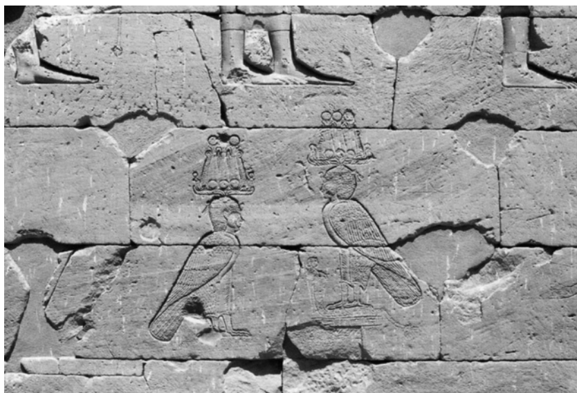
Fig. 3 Graffiti de visiteurs à Kalabchah. D'après Hölbl 2004, 130, fig. 189.

et solaire. Mandoulis est donc à la fois une image du pouvoir royal et de sa transmission, une figure dédoublée entre un détenteur du pouvoir et un héritier, et une figuration des étapes du cycle solaire, soleil à son zénith (le grand dieu, netjer aa ) ou force renaissante du soleil (l'enfant, pa shered ). Il y a une interpénétration très forte entre les deux formes du dieu adulte et du dieu enfant et de nombreuses confusions iconographiques et onomastiques, peut-être délibérées, qui s'accroissent à mesure qu'on s'éloigne du cœur du sanctuaire, rendent la compréhension de Mandoulis délicate et justifient donc la requête du dédicant. Toutefois, malgré cette complexité, certains visiteurs avaient manifestement connaissance de la double nature du dieu de Kalabchah, comme en témoignent des graffiti représentant deux formes du dieu (fig. 3) 36 .