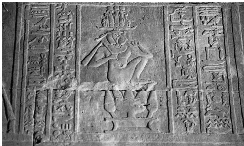
Fig. 5 Mandoulis l'enfant dans le pronaos de Kalabchah. D'après Hölbl 2004, 126, fig. 180.

la religion égyptienne. La notion de spectacle est tout à fait fondamentale dans le contexte du temple égyptien et de la transmission du savoir aux « laïcs » : la fête égyptienne, occasion exceptionnelle de contact entre le monde du dieu et les fidèles, se dit en effet khâ , « apparition », et culmine sur l'apparition processionnelle, en public, de la statue divine 44 . Nous y voyons l'indice d'une mise en scène spectaculaire de l'image ou de la statue divine par le clergé du temple.