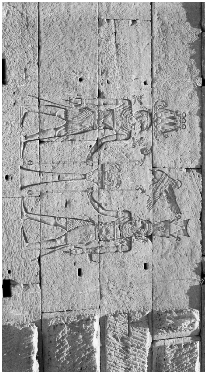
Fig. 4 La chapelle des deux Mandoulis à l'arrière du temple. D'après Hölbl 2004, 131, fig. 191.