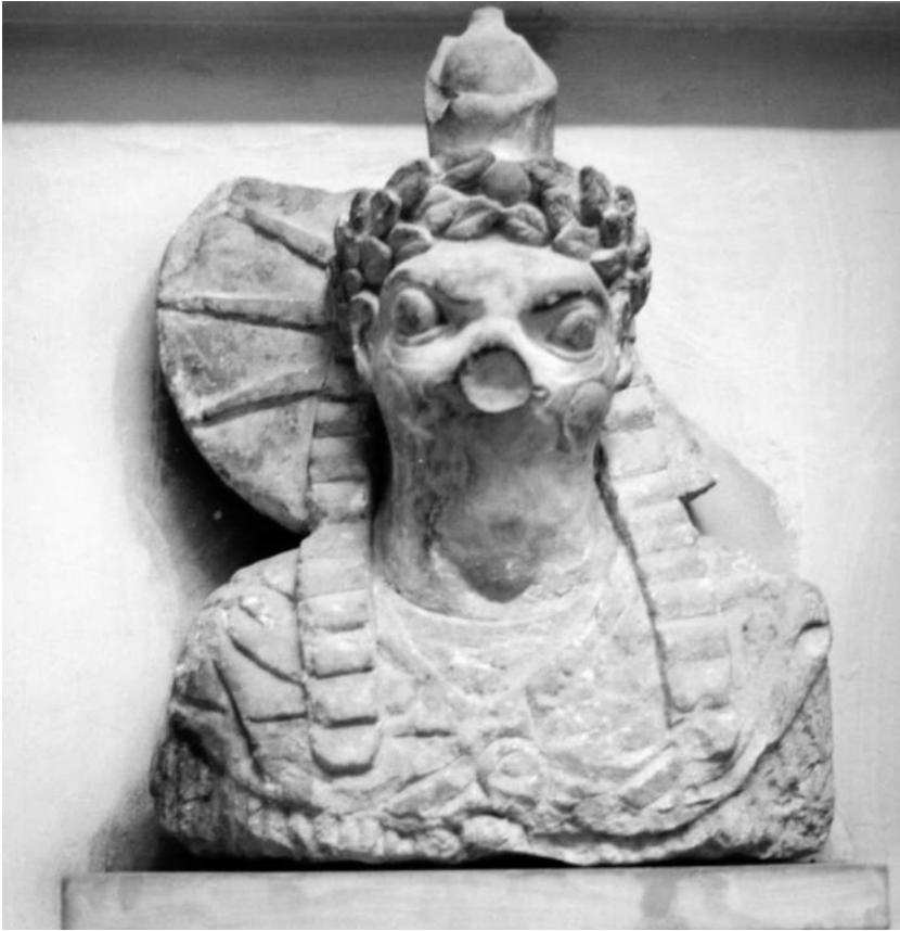
Fig. 6 Une statue parlante.

processions de la barque divine, trop exceptionnelle pour répondre aux attentes permanentes des fidèles et probablement trop coûteuse en une période de fort déclin économique des temples, cède ici la place, sans nécessairement disparaître pour autant, à une nouvelle technique rituelle. L'évolution de la relation du fidèle au dieu dans le sens d'une piété personnelle, amorcée en Égypte depuis le Nouvel Empire 91 , s'adapte à une curiosité que des individus comme Jamblique ont par la suite emblématisée 92 . La concurrence était par ailleurs forte avec