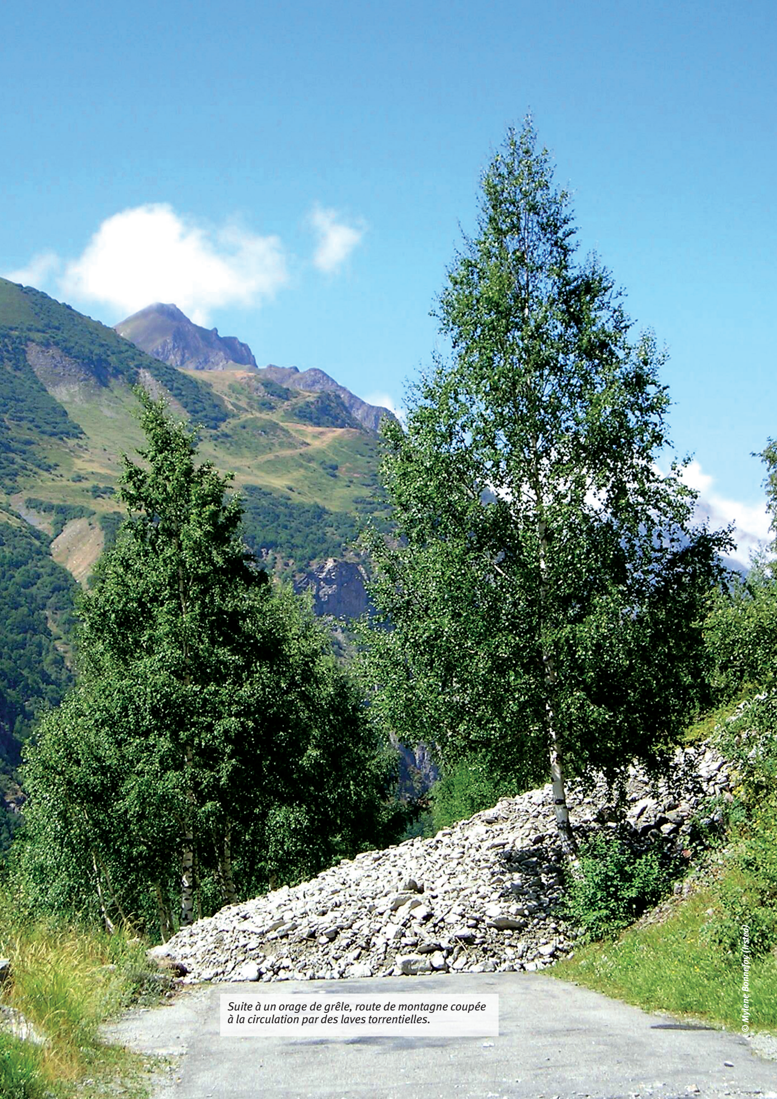
Suite à un orage de grêle, route de montagne coupée à la circulation par des laves torrentielles.