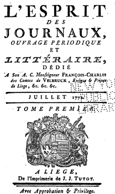
Figure 6 : Page de titre de L'esprit des Journaux , tome 1, 1772