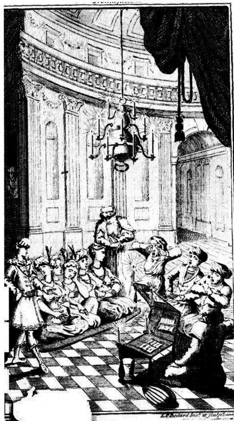
Figure 2 : Thomas-Simon Gueullette, Les sultanes de Guzarate (1732), frontispice de la traduction anglaise Moghul Tales , 1743.