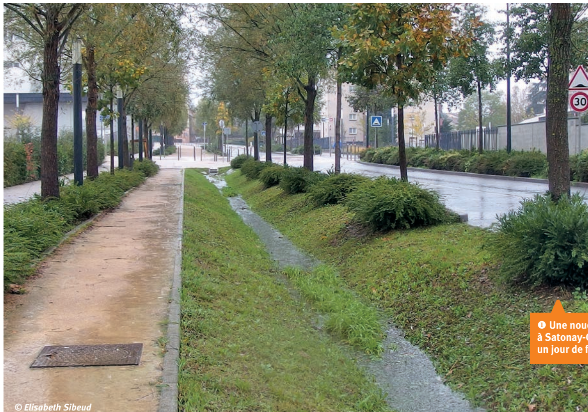
① Une noue à Satonay-Camp un jour de forte pluie.