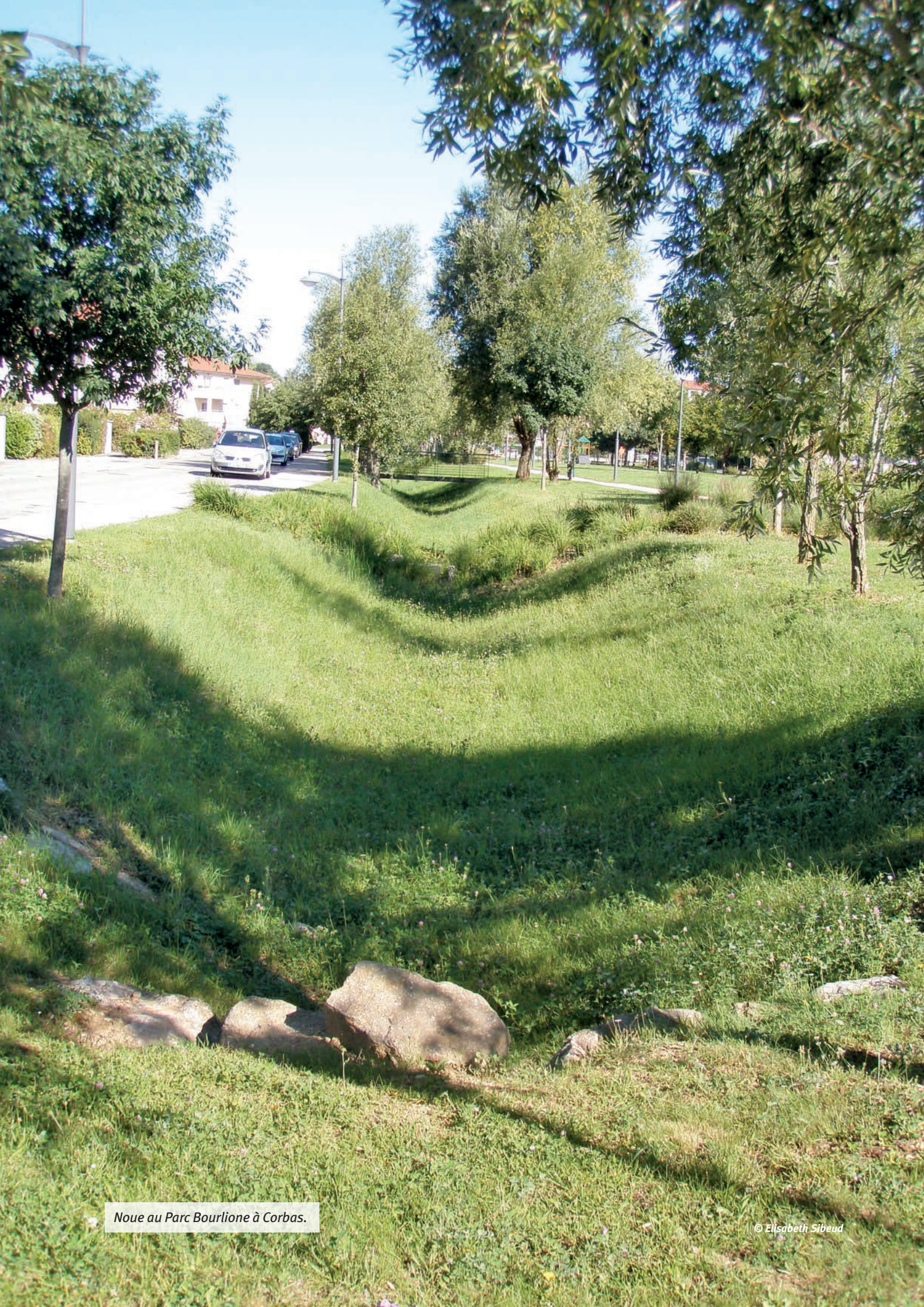
Noüe au Parc Bourlione à Corbas.