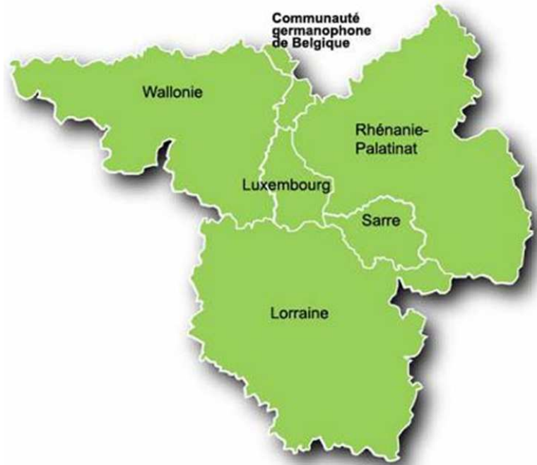
Figure 1 : Grand-Duché de Luxembourg et Lorraine au cœur de la Grande Région