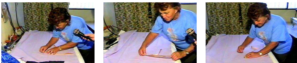
FIGURA 10: As medidas com fita métrica

Noedi: [...] porque eu fui fazer um curso, aí teve uma época [...] tavam dando curso, eu fui fazer, e aí eu não entendia nada matemática da professora lá no quadro, eu disse: professora eu não entendo nada sua matemática aí, porque eu entendo um pouquinho de costura, então tu passa na loja e compra 2 tecidos, tu faz uma blusa assim, assim, e uma sainha. No dia de entrega os diplomas tu vem aqui, eu fui e tirei o segundo lugar, mas eu tirei o segundo porque eu não participei do curso né, é isso aí.