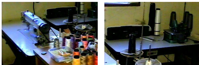
FIGURA 9: Máquinas de costura

troca, pra borda tem que trocar, essa é bem diferente né, agora aquela ali e como essa, tendo bem fiadinha, bem como que se diz, lubrificada, não tem problema, e isso aí.