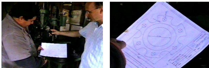
FIGURA 8: O desenho para a furagem do cubo de roda

Continuando a explicação, toma o desenho dessas peças que tem em mãos, nos detalhando e fazendo a sua análise e interpretação.