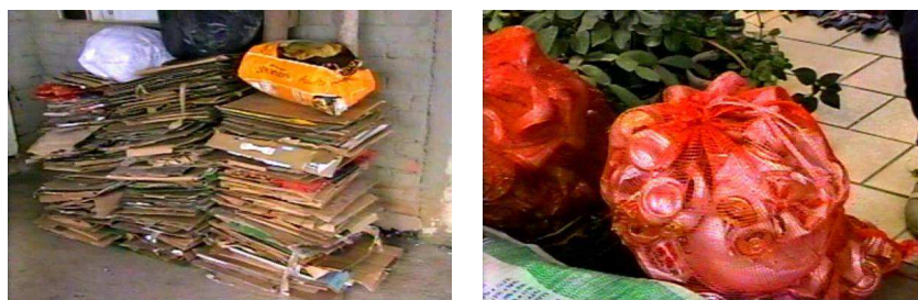
FIGURA 1: A organização da coleta

Um dos primeiros conhecimentos observados na prática dos catadores de lixo e referente a área da matemática reside na classificação do material coletado, na triagem e na separação de papelão, latas, litros, e a organização espacial como podemos visualizar na figura e nos fragmentos de nossa entrevista: