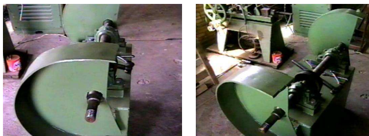
FIGURA 6: Máquina de rebarbeação

José: Olha, temo aqui uma máquina, uma máquina de esmirilhado 2 , para fazer rebarbeamento de peças que sai da fundição né, então dá um acabamento nas peças, tem várias maquininhas aqui que o rapaz vai começa uma empresa e nos fizemos aqui, tem uma pronta, temo só fazendo a parte mais técnica dela, ajuste, alinhamento, rotação, proteção, e vai fazer a rebarbeação, oh.