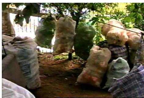
FIGURA 2: Conservação e proteção do material

Todo o material, depois de passar pela triagem, é colocado em enormes sacos nos quais é conservado até a entrega. Quando cheios, chamam atenção não somente pelo volume, mas pela “técnica” usada: os sacos ficam suspensos do solo, amarrados por cordas entre as árvores do pequeno terreno que possuem. São meios ou formas encontradas para superarem as dificuldades de espaço, a investida de animais e a deterioração do material.