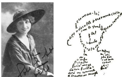
Figure 2: Deux types d'icônes-images, caractérisées par une similarité sensible avec leur objet, mais avec un taux de diagrammaticité différent: élevé pour le calligramme La femme au chapeau d'Apollinaire (une image diagrammatique, à droite), faible pour la photo de la femme concernée (une image simple, à gauche).

vers l'objet qui le produit ; images métaphoriques telles que zigzag , bric-à-brac ou gnangnan exploitant sélectivement des propriétés en partie acoustiques, en partie articulatoires du signifiant pour évoquer des aspects non immédiatement acoustiques du signifié) ou encore lorsqu'il s'appuie sur des propriétés du signifiant régulièrement exploitées par le système de valeurs différentielles qui constitue la langue, et donc en partie déterminées par ce dernier ( image diagrammatique ).