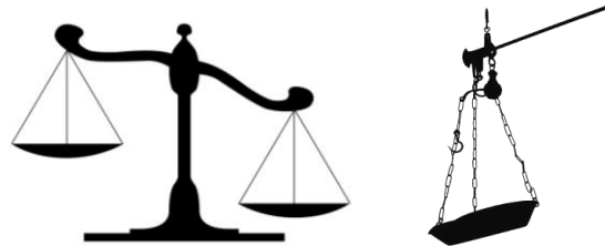
Figure 4: Balance commune et balance romaine. Seule la première constitue une métaphore graphique de la justice.

des images (au sens propre du terme) comme signifiants d'objets concrets qui, eux, opèrent comme des métaphores de concepts généraux. Par exemple, l'image d'une balance est la métaphore graphique traditionnelle de la justice (voir la figure 4, à gauche).