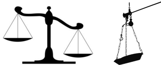
Figure 4: Balance commune et balance romaine. Seule la première constitue une métaphore graphique de la justice.

des images (au sens propre du terme) comme signifiants d'objets concrets qui, eux, opèrent comme des métaphores de concepts généraux. Par exemple, l'image d'une balance est la métaphore graphique traditionnelle de la justice (voir la figure 4, à gauche).