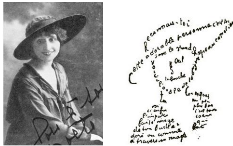
Figure 2: Deux types d'icônes-images, caractérisées par une similarité sensible avec leur objet, mais avec un taux de diagrammaticité différent: élevé pour le calligramme La femme au chapeau d'Apollinaire (une image diagrammatique, à droite), faible pour la photo de la femme concernée (une image simple, à gauche).

vers l'objet qui le produit ; images métaphoriques telles que zigzag , bric-à-brac ou gnangnan exploitant sélectivement des propriétés en partie acoustiques, en partie articulatoires du signifiant pour évoquer des aspects non immédiatement acoustiques du signifié) ou encore lorsqu'il s'appuie sur des propriétés du signifiant régulièrement exploitées par le système de valeurs différentielles qui constitue la langue, et donc en partie déterminées par ce dernier ( image diagrammatique ).