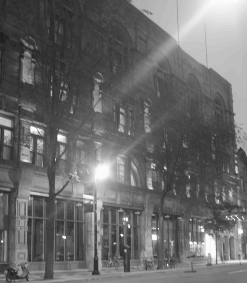
Un exemple de travail sur les ambiances urbaines : le Monument-National éclairé de rouge selon le Plan lumière du Quartier des spectacles. Photo : Marie-Laure Poulot, 2012

Montréal s'est même dotée d'une Charte du piéton en 2006, qui insiste sur la nécessité de réduire la dépendance à l'automobile au profit d'un Plan de transports prenant mieux en compte la marche comme mobilité quotidienne en ville 15 : l'objectif est d'assurer la sécurité du piéton par rapport à l'automobile, de publiciser toujours davantage les rues piétonnes ou les fermetures de rues (piétonisation permanente ou temporaire), mais aussi de promouvoir la promenade urbaine dans un contexte plus vert 16 .