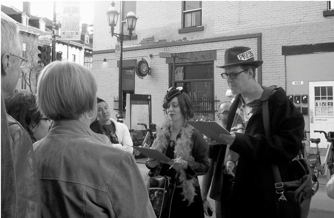
Promenade de Jane, 6 mai 2012 : la visite de l'ancien Red Light (par deux acteurs de l'association Save the Main) qui cherche à souligner les aménagements récents du Quartier des spectacles et à mobiliser les participants pour la protection des anciens bâtiments.