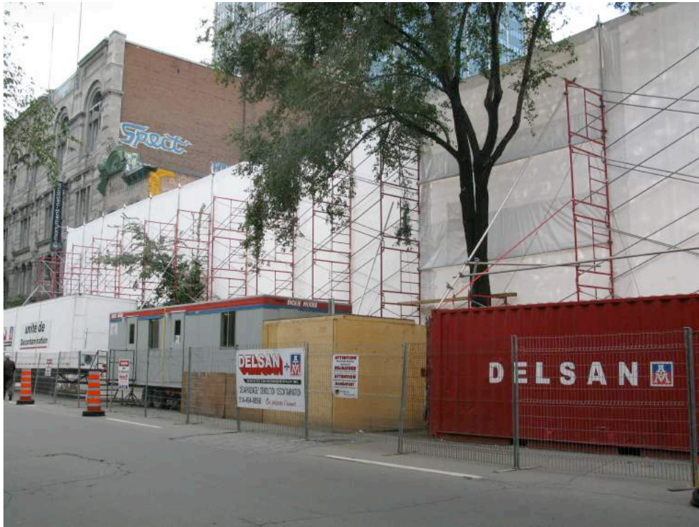
FIGURE 4 Les démolitions à l'œuvre sur l'îlot Saint-Laurent ; à gauche, le Monument-National. Photo : Marie-Laure Poulot, octobre 2012.