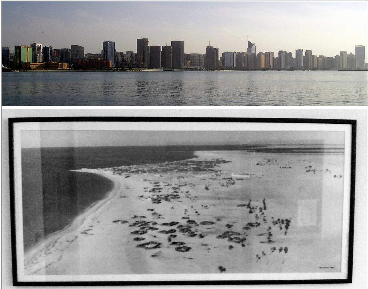
Figure 4 – La toposphère anthropisée : Abou Dhabi en 1955 et en 2007 20

consommation des formes du relief pré-urbaines (Figure 4), comparables à d'autres mutations survenues après la Seconde Guerre mondiale en Amazonie, en Asie des moussons, ou en Chine continentale, humainement (mais non géologiquement) irréversibles.