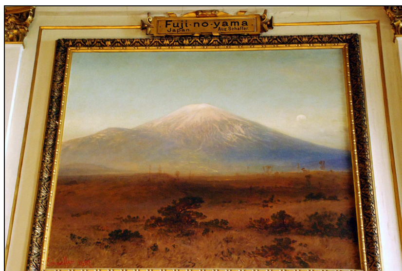
Figure 2 – Le « Fuji-no-yama » (Japon), peinture d'August Schaeffer (1887), Naturhistorisches Museum Wien. Photo prise le 30 avril 2014, © Christian Giusti