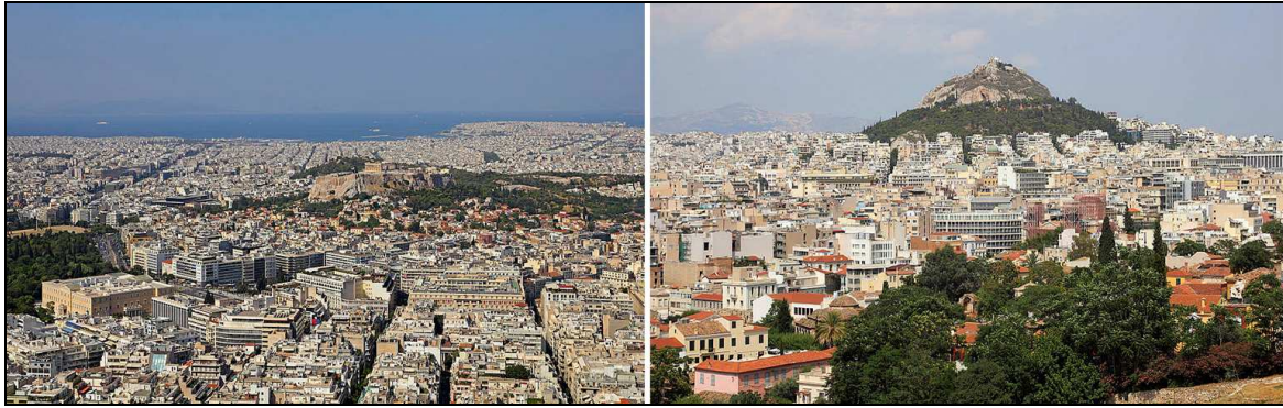
Figure 5 – Étalement de la nappe bâtie et encerclement d’îlots de reliefs à Athènes (Grèce). Athènes et Le Pirée vus du Lycabette (gauche) ; le Lycabette vu de l’Acropole (droite) 28 .