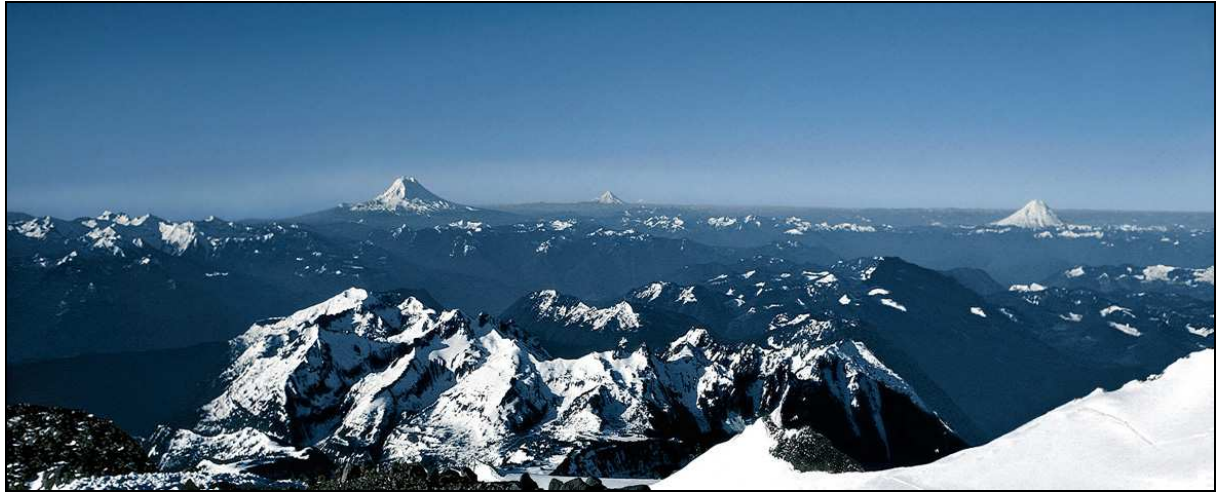
Figure 3 – Le Mont Adams, le Mont Hood et le Mont St Helens avant le 18 mai 1980, pris des pentes du Mont Rainier en direction du sud 15