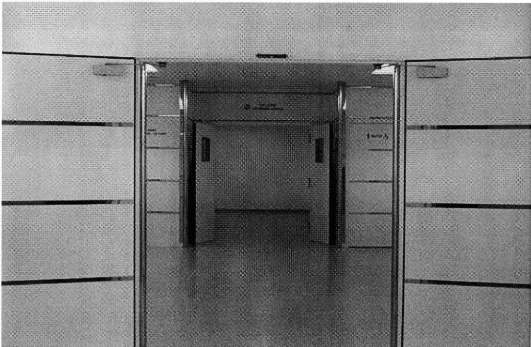
Entrée de l'espace IRM-scanner