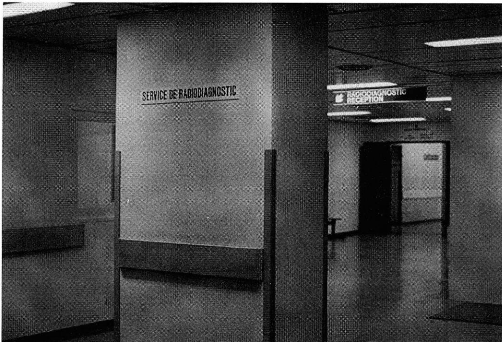
Espace d'accueil depuis la sortie du hall des ascenseurs