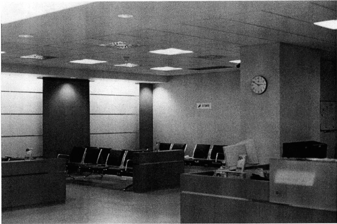
Espace d'attente IRM-scanner