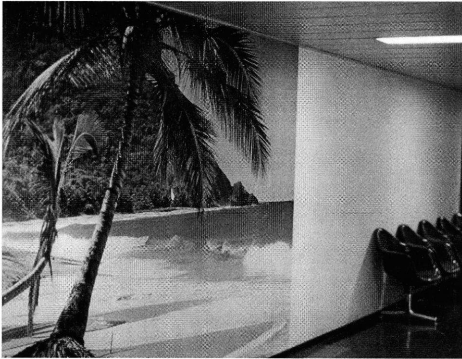
Poster se trouvant dans le couloir Beaugency