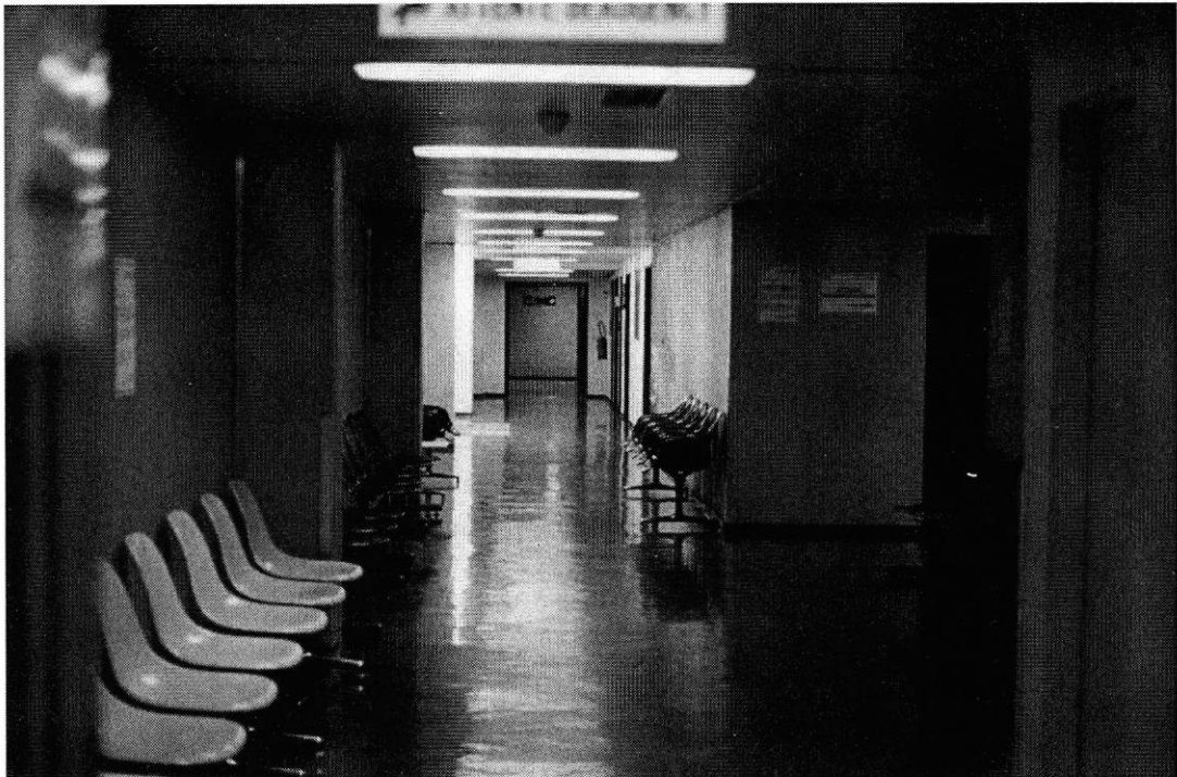
Couloir de l'attente Beaugency