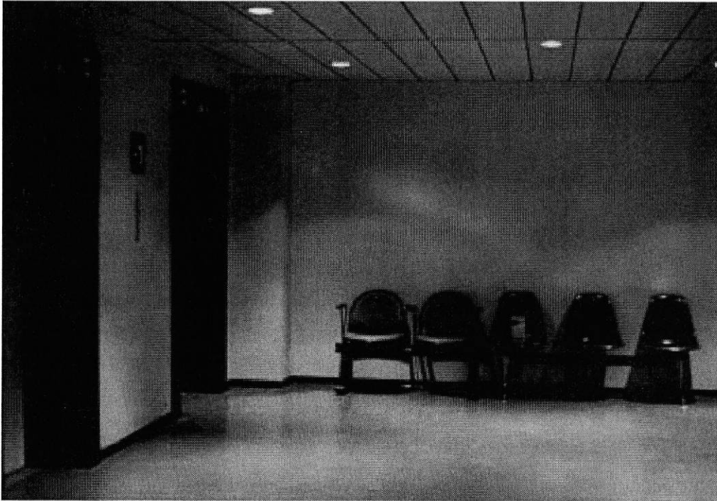
Hall des ascenseurs