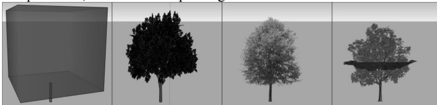
Figure 1. Quatre représentations différentes d'arbres : géométrie à douze faces (a), géométrie à 25000 faces (b), billboard vertical (c) et billboard biplan (d).

Si le modèle de sol préexiste, les contours extérieurs de bâti sont placés à l'altitude des gouttières (telle que renseignée dans la géométrie). Lorsque le contour ne forme pas une face polygonale, la coplanarité des points est assurée en « forçant » les altitudes de chacun des sommets à une altitude moyenne. Ces contours extérieurs, assimilés à des toits « flottant » à distance du sol, sont alors « extrudés » en direction du sol d'une hauteur équivalente à la valeur de l'attribut HAUTEUR du bâtiment et via le mécanisme de pushpull déjà mentionné. Lorsque le prisme droit ainsi formé, correspondant à l'enveloppe extérieure du bâtiment, ne touche pas le sol, l'extrusion est prolongée.