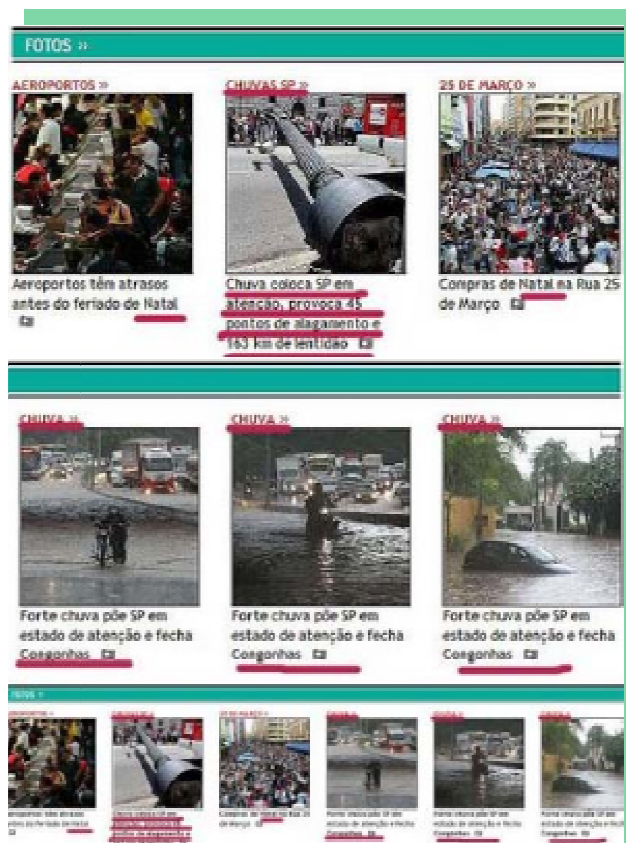
Fig. 3. Estadão.com , 2008, palavras repetidas na edição

DOI: http://dx.doi.org/10.20873/uft.2447-4266.2015v1n1p63