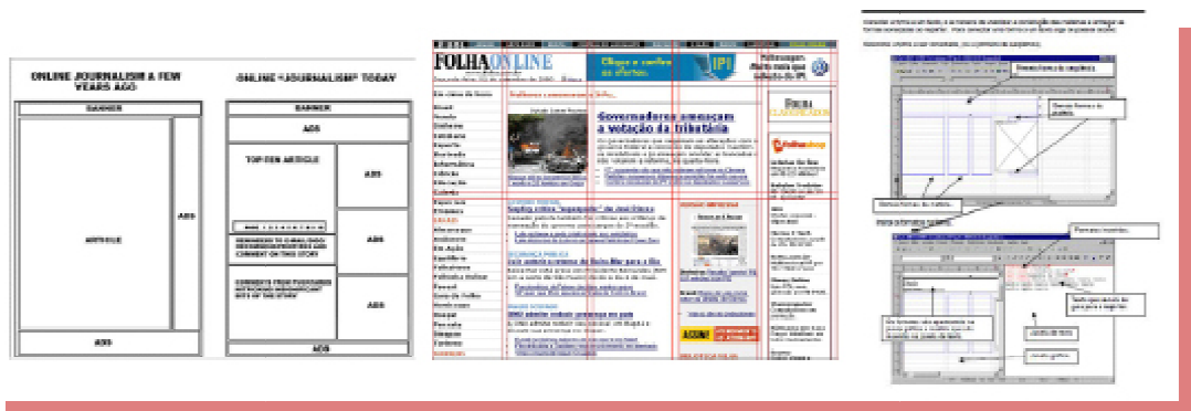
Fig. 1. Diagramação da Folha Online entre layout web (esq.) e impresso (dir.)

A análise dos 15 principais jornais brasileiros e estrangeiros que estão na rede - Globo Notícias (G1) , UOL Notícias Folha (Folha.com) , Terra Notícias, Estadão.com.br , Google News , iG News (Último Segundo) , R7 Notícias , BBC , The New York Times , Band.com.br , CNN , MSNBC , El País , The Guardian e Huffington Post - revela que suas interfaces ainda reproduzem metáforas analógicas 6 .