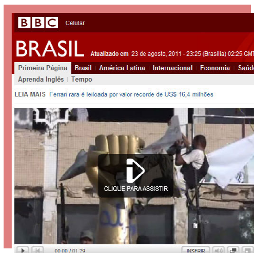
Fig. 5. Versão brasileira de destaque em vídeo da BBC, 2011.

Por outro lado, havia (e ainda há) jornais com mais de 100 chamadas em sua interface principal, como o Times 8 . De novo o exemplo do jornal americano é