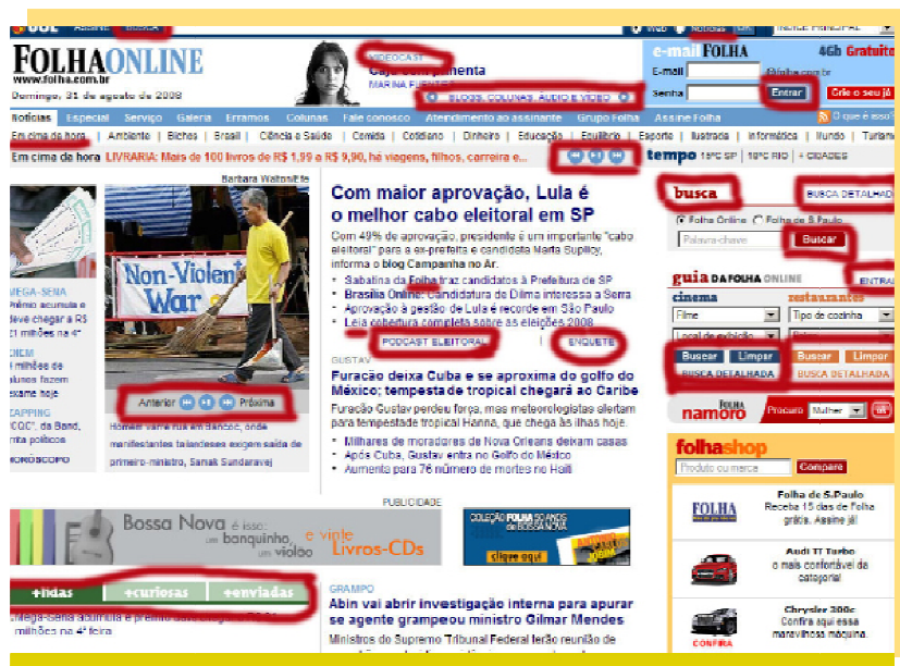
Fig. 2. Folha Online , 2008, redundância e uso de setas no espaço tridimensional que é a web

Curioso anotar que, ao longo dos últimos anos, transposta para a internet ( web e aplicativos, entre outros), a ideia segundo a qual a organização se dá por critérios de noticiabilidade e valor-notícia de composição levou a extremos – da absoluta economia ao total exagero. O exemplo da Folha de S.Paulo apresentado na próxima página (Fig. 2) é exemplo disso: as setas imitando um controle remoto de tevê se assemelham à interface do projeto Movie Map 7 , do Massachusetts Institute of Technology, desenvolvido por Andrew Lippman em 1978.