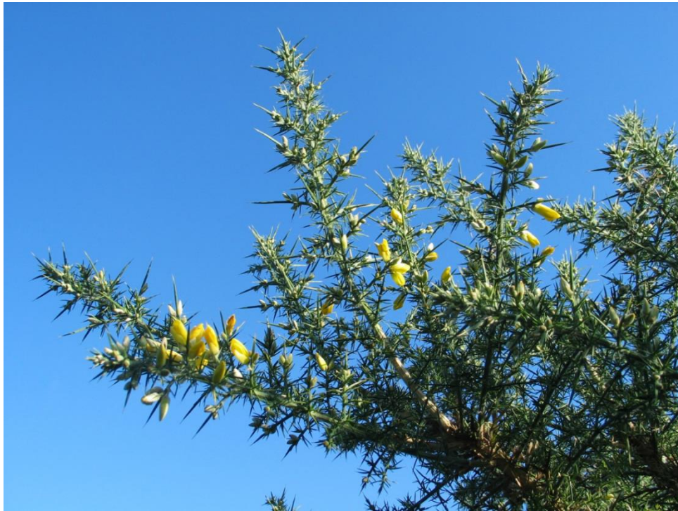
Figure 1. — L'ajonc d'Europe ( Ulex europaeus ): un arbuste très épineux (photo Atlan, 2008)