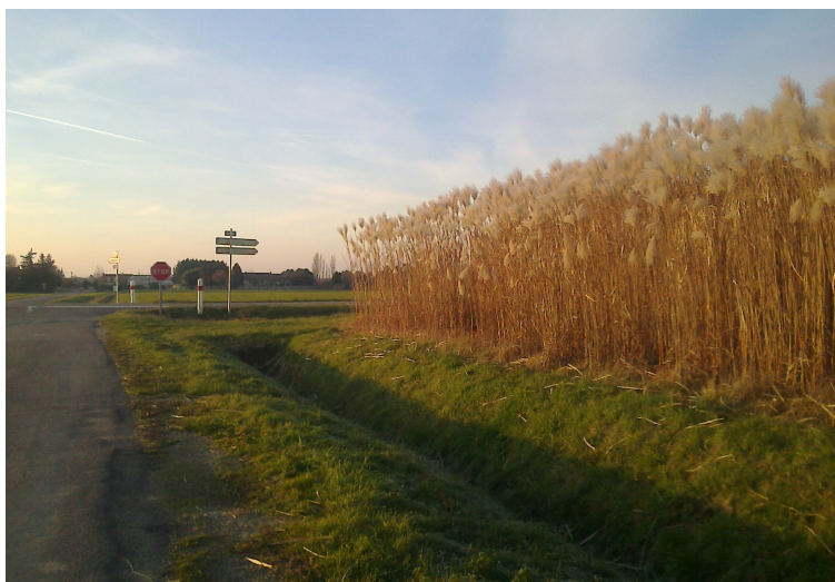
FIGURE 1 – Vue d'une parcelle de miscanthus